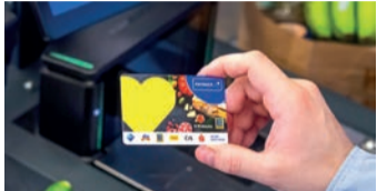
Jetzt bei EDEKA wertvolle PAYBACK Punkte sammeln

Bei EDEKA gibt es jetzt für jeden Einkauf 1 PAYBACK Punkt pro 2 Euro