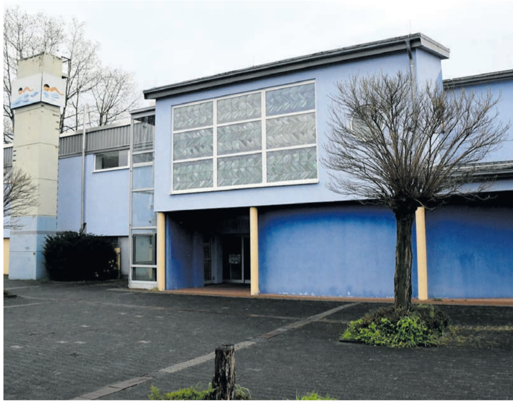
Das Areal mit dem alten Münsterer Hallenbad dient derzeit im Wesentlichen als Parkplatz und als Interimsdomizil der Kita Sonnenblume. Zudem wird das Blockheizkraftwerk im Bad noch in der benachbarten Kita „Haus der Kinder“ genutzt. Nun sind die Gemeinde und ein Projektentwickler mit großen Neubau-Plänen an die Öffentlichkeit gegangen.