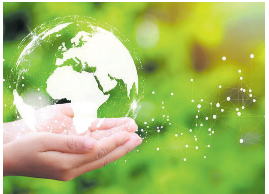
Weniger Müll im Krankenhaus, grüne Ideen in der Pflege, niederschwellige Gesundheitsangebote: Beim „Deutschen Nachhaltigkeitspreis Gesundheit“ wurden wegweisende Projekte ausgezeichnet.

Spannende Ideen für mehr Nachhaltigkeit in Medizin und Pflege