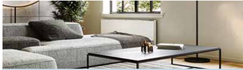
Tiefemperaturheizkörper kommen schon mit 35 Grad Vorlauftemperatur aus und sind bei gleicher Größe deutlich effizienter als herkömmliche Geräte.

(DJD-K). Die größte CO 2 -Quelle in deutschen Haushalten ist laut Umweltbundesamt die Heizung. Um das zu ändern, sollen nach dem neuen Gebäudeenergiegesetz (GEG) in den kommenden Jahrzehnten Gas- und Ölheizungen zunehmend durch umweltfreundlichere Heiztechniken, insbesondere Wärmepumpen, ersetzt werden. In Neubauten sind diese schon Standard, doch Eigentümer von älteren Bestandsgebäuden sind oft unsicher, ob sie ihr Haus mit einer Wärmepumpe effektiv beheizen können. Denn Wärmepumpen können nur mit niedrigen Vorlauftemperaturen von ca. 35 Grad Celsius wirklich effizient arbeiten. Damit lassen sich aber viele Häuser mit herkömmlichen Heizkörpern nicht warm bekommen. Lange hieß es deshalb, dass Wärmepumpen nur zusammen mit Fußbodenheizungen oder zumindest deutlich größeren Heizkörpern sinnvoll sind. Doch das ist Geschichte.