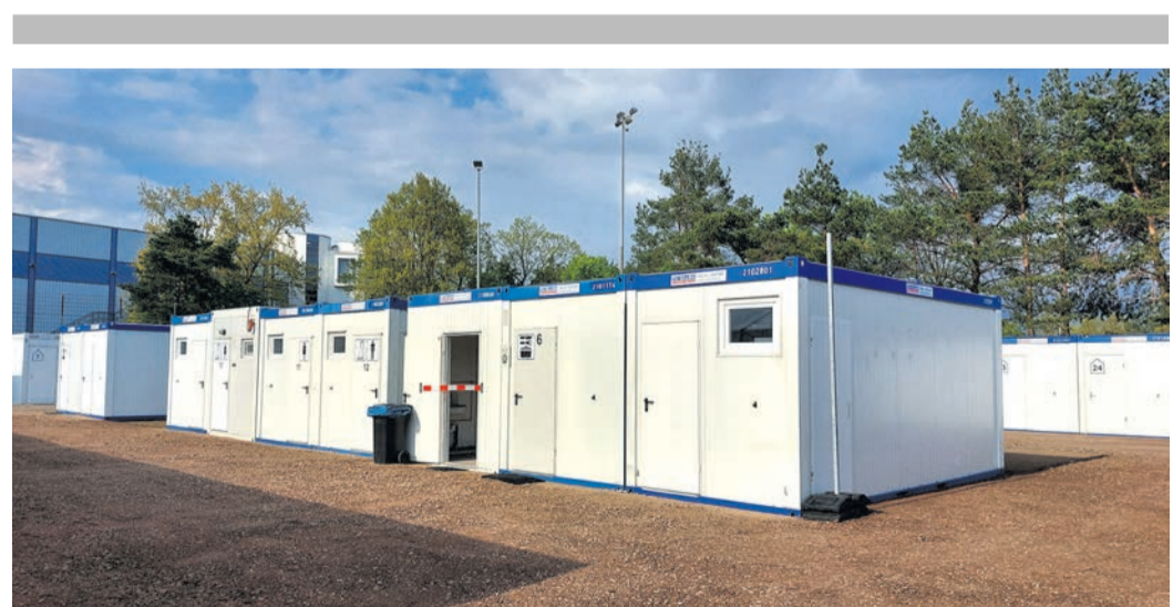
Die Gemeinschaftsunterkunft am Kultur- und Sportzentrum Martinsee bei der Eröffnung im April 2022, der Kreis löst die Unterkunft nun auf. Lesen Sie auf Seite 4.