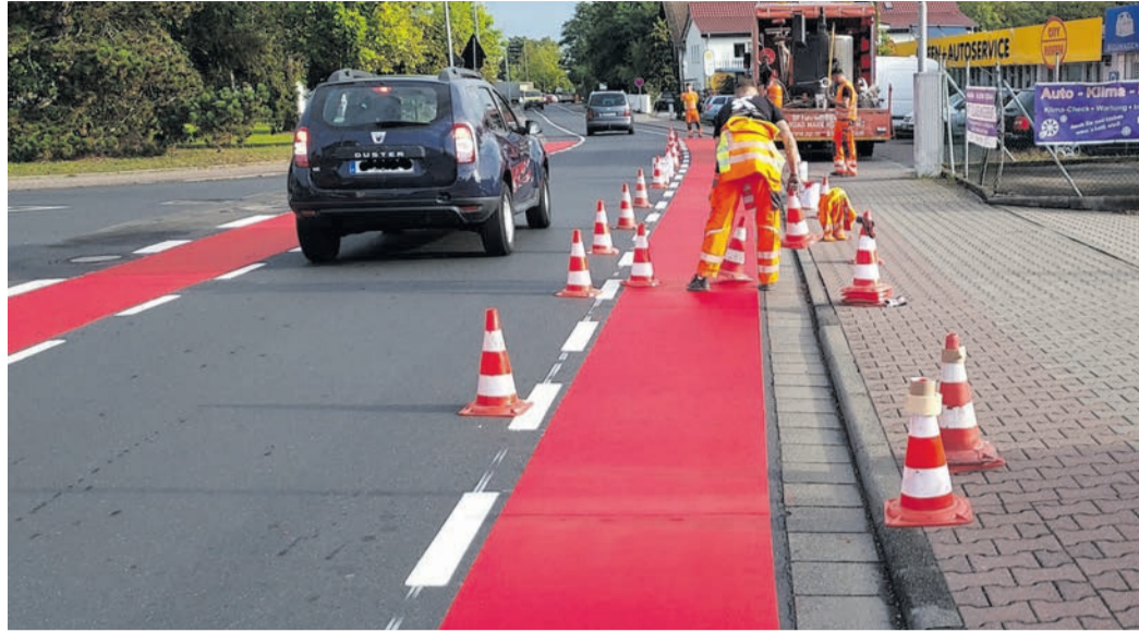
Die Industriestraße während der Markierungsarbeiten im Jahr 2023.

Heusenstamm (NZH) Die Hinweise auf den Verkehrsversuch in der Industriestraße wurden mittlerweile entfernt – so ist hier eine realistische Verkehrssituation entstanden. Die bisherigen Ergebnisse sind vielversprechend: Die Nutzung der Fahrbahn durch Radfahrende ist von rund zehn Prozent vor Beginn des Versuchs auf 85 Prozent gestiegen. Vor dem Versuch nutzte der Großteil der Radfahrenden den Gehweg, was zu einer erhöhten Gefährdung von Fußgängerinnen und Fußgängern und mobilitätseingeschränkten Personen führte. Durch den Verkehrsversuch hat sich dieses Verhalten maßgeblich verbessert. Auch das Verhalten der Autofahrenden hat sich verändert: Sie bleiben im Begegnungsfall meist hinter den Radfahrenden, anstatt sie zu überholen, was den Sicherheitsabstand deutlich verbessert hat. Die genannten positiven Entwicklungen führten zu einem Anstieg des Radverkehrs um etwa 30 Prozent. Zählungen im September 2024 belegen, dass trotz widriger Wetterbedingungen im Durchschnitt 305 Radfahrende pro Tag unterwegs waren, an verkehrsreicheren Tagen bis zu 370. In der letzten Sitzung im Jahr 2024 im Dezember hatten die Heusenstammer Stadtverordneten die Verlängerung des genehmigten Verkehrsversuchs in der Industriestraße sowie die wissenschaftliche Begleitung durch die Hochschule Darmstadt um zwei Jahre beschlossen. So können die bisherigen Erkenntnisse vertieft, die langfristigen Auswirkungen