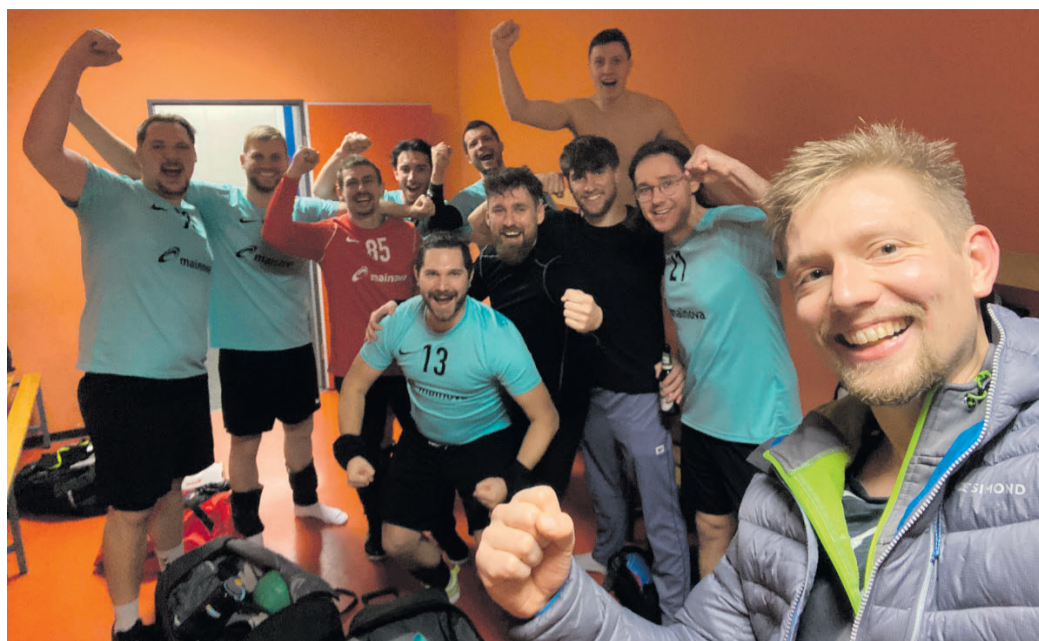
Die erfolgreichen Herren der HSG Obertshausen/Heusenstamm.