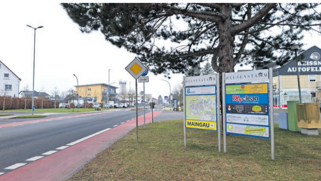
Aktuell bestückte städtische Werbeanlage in der „Frankfurter Straße/Am Goldberg“.

Direktwerbung GmbH Ein Unternehmen der EGRO Mediengruppe Verlag - Zustellgenehmigung - Agentur