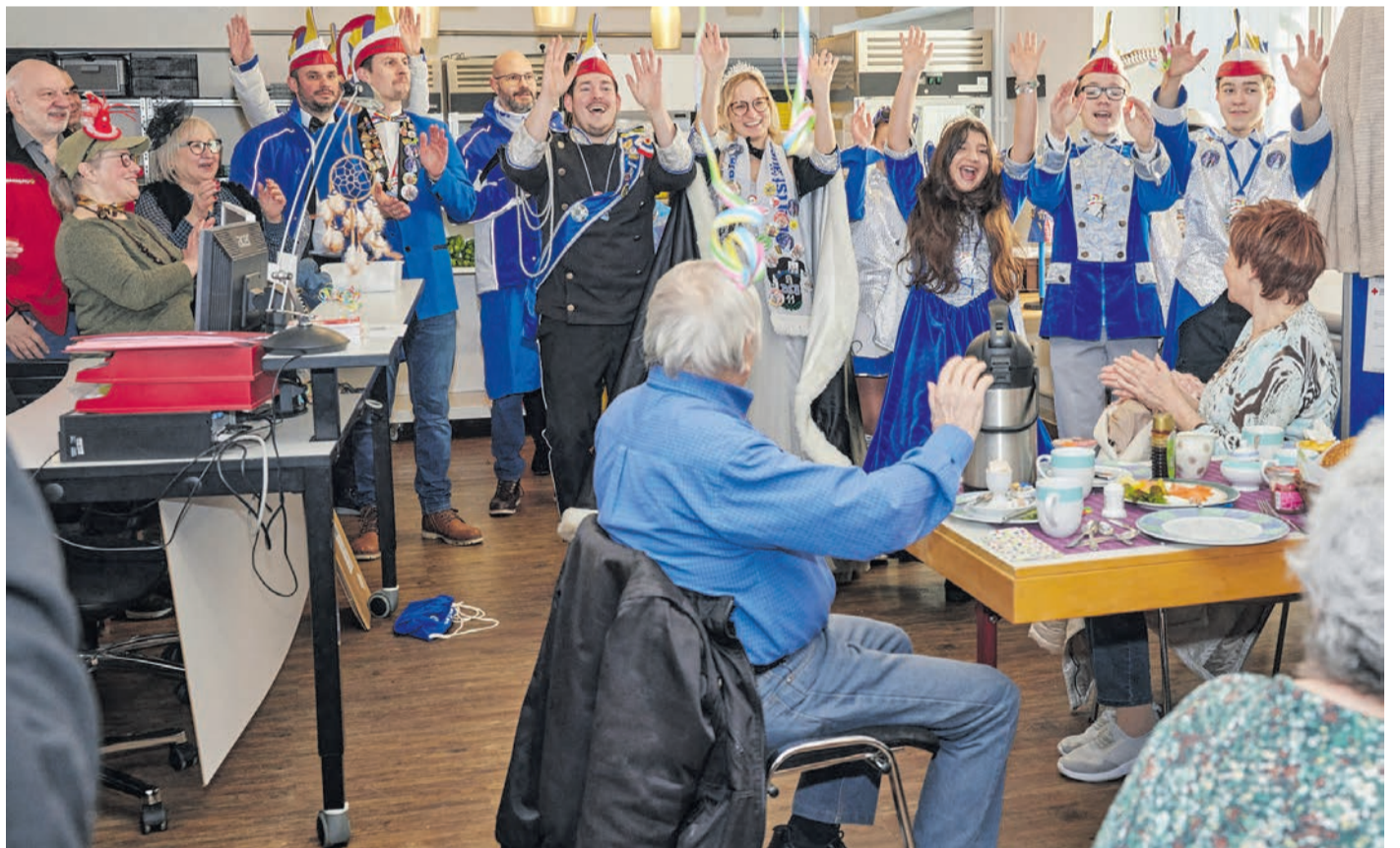
Besuch der Tollitäten beim Seniorenfrühstück des Lädchens.