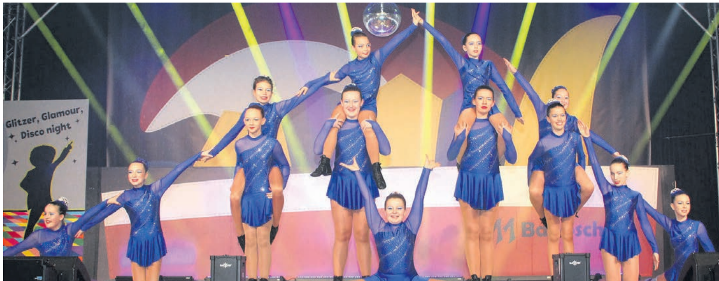
Blue Stars beim Kriebelkaffee der Babbscher.