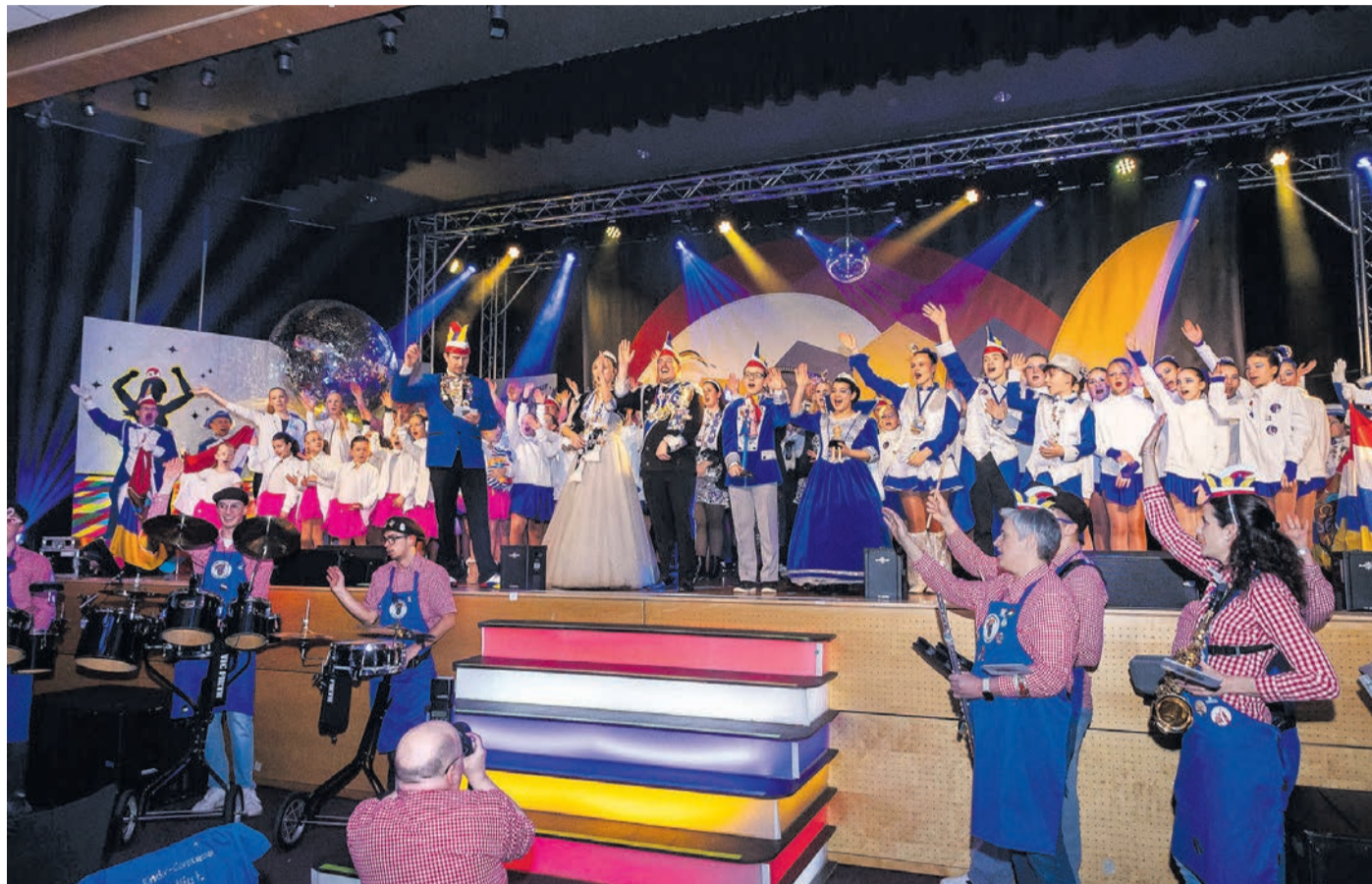
Zur Eröffnung kamen alle auf die Bühne.

Die Tanzgruppen sind eine Stärke der Babbscher und auf der Bühne erlebten die zahl-