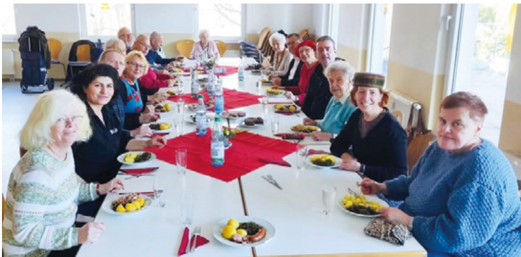
Gemeinsam Mittagessen bei den SeniorInnen in Kranichstein.