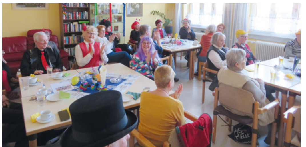
Kräppelkaffee bei den Aktiven Senioren Wixhausen vergangene Saison.

Wixhausen (rb). Es darf wieder gefeiert werden! Auch die DRK Gemeinschaft Aktive Senioren Wixhausen feiert wieder Fastnacht. Dabei sollen die Alltagsorgen vergessen und mit viel Spaß neue Zuseher gewonnen werden.