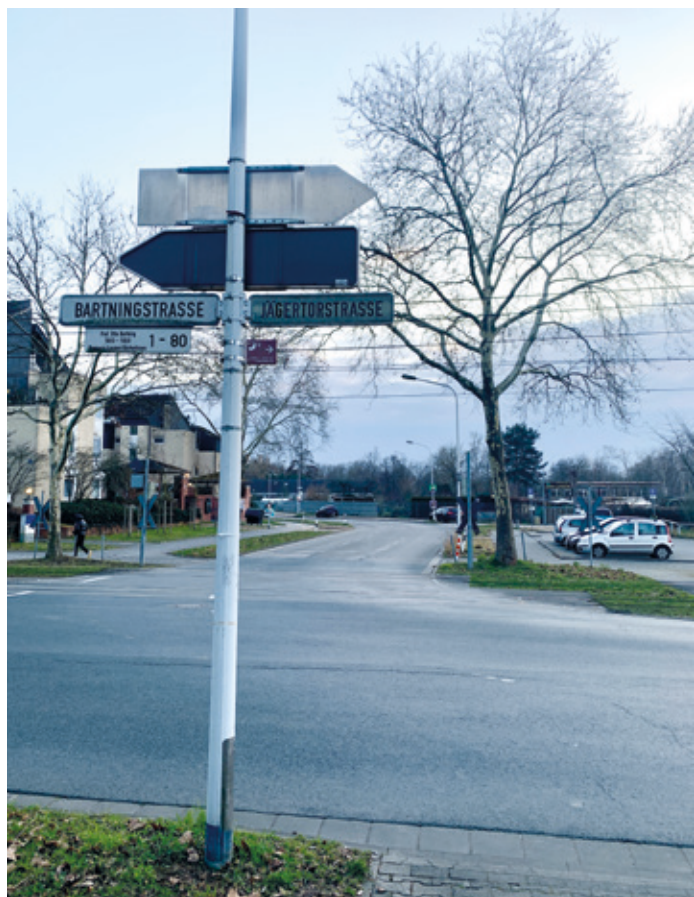
Der geplante Ausbau umfasst die Erneuerung der Fahrbahndecke, bessere Fuß- und Radwege sowie Verbesserun-

Kranichstein (nd). Gute Nachrichten für Kranichstein: Der Magistrat der Stadt Darmstadt hat zusätzlichen Haushaltsmitteln für den Ausbau der Jägertorstraße zwischen Parkstraße und Kranichsteiner Straße zugestimmt. Damit kann ein bedeutendes aber lang diskutiertes Infrastrukturprojekt für den Nordosten der Stadt realisiert werden. Die Baumaßnahmen sollen nicht nur die Verkehrssituation verbessern, sondern auch die Aufenthaltsqualität und Verkehrssicherheit in dem Bereich erhöhen. Die Jägertorstraße ist eine wichtige Verbindung für den Stadtteil, wird aber den aktuellen Anforderungen an eine moderne Infrastruktur nicht mehr gerecht. Hildegard Förster-Heldmann, Landtagsabgeordnete und Vorsitzende des Kulturausschusses, begrüßt die Entscheidung: „Mit dem geplanten Ausbau wird die Jägertorstraße sicherer und attraktiver für alle Verkehrsteilnehmenden – ob zu Fuß, mit dem Rad oder dem Auto. Besonders freut mich, dass hierbei auch die Verkehrsberuhigung und die Aufenthaltsqualität im Stadtteil eine Rolle spielen.“