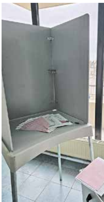
Wahlkabine im Stadthaus.

Um möglichst vielen Wahlberechtigten die Briefwahl zu ermöglichen,