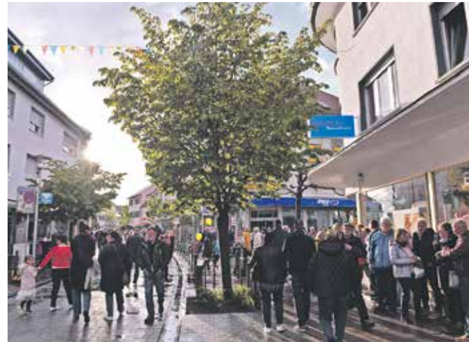
Archivbild Frühlingserwachen 2023.

Am 26. und 27. April 2025 präsentieren Handel und Gewerbe, Dienstleister und Gastronomen aus der Kreisstadt und dem Gerauer Land ihre Produkte und Dienstleistungen auf einer großen Gewerbeschau in der Groß-Gerauer Innenstadt. Die Veranstaltung zu Beginn der warmen Jahreszeit wird begleitet von einem Stadtfest und einem verkaufsoffenen Sonntag für die ganze Familie. Damit ist es dem Gewerbeverein gelungen, auch nach dem Ausfall