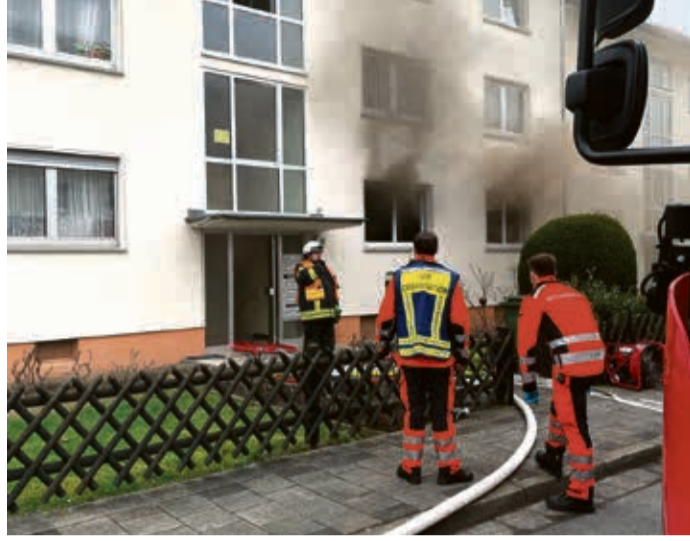
Zu einem Wohnungsbrand (Bild links) im Erdgeschoss eines Mehrfamilienhauses in der Straße „Im Vogelseen“ kam es am Samstagmorgen. Am Samstagabend kam es dann zu einem Kellerbrand in der Friedrich-Ebert-Straße.

Dank des schnellen und koordinierten Einsatzes der Feuerwehrkräfte konnte das Feuer zügig unter Kontrolle gebracht und gelöscht werden. Im Zuge der Lösch- und Rettungsarbeiten mit mehreren Trupps unter Atemschutz wurde im Brandraum eine Person leblos aufgefunden. Zwei weitere Bewohner