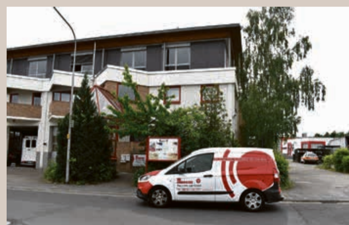
Die Johanniter-Unfallhilfe in Nieder-Roden mit Qualitäts-Fenstern mit Wärmeschutzglas.

Qualitäts-Fenster. Um eine maximale Dämmleistung zu erreichen, sind die Systeme von Sommer Fenster mit 3-fach Wärmeschutz. Verglasung inzwischen mehr denn je gefragt. Bei Sommer Fenster informiert man gerne über alle technischen Details der modernen Fenster- und Türe Systeme und hilft Ihnen dabei, die optimale Lösung für Ihre individuellen Anforderungen zu finden. Auch die notwendigen baulichen Maßnahmen bei Sanierungsvorhaben geht man Schritt für Schritt mit Ihnen durch, sodass Sie genau wissen, was auf Sie zukommt.