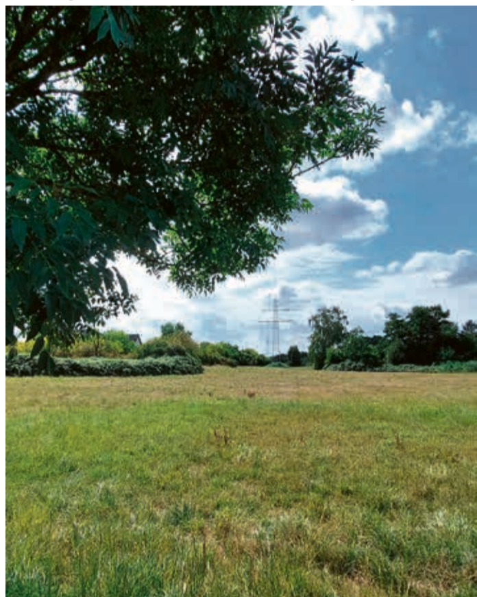
Hochspannungsleitungen in der Heusenstammer Biebraue.

Überquerung der Autobahn und der S-Bahn-Trasse. In diesem Abschnitt außerhalb der Stadt werden neue Freileitungsmasten für die Hochspannung aufgestellt. Der Trassenbau hinter dem Schloss liegt im Plan. Nach der Bohrspülung werden in den nächsten Tagen die Schutzrohre für die Kabelsysteme eingezogen. Anschließend werden die Schutzplatten, auf denen derzeit die Rohre liegen, zurückgebaut, sodass die Arbeiten zu Beginn der Vegetationszeit abgeschlossen sein werden. Danach geht es mit einer Bohrspülung am Spielplatz „Schlosswiese“ weiter, die voraussichtlich bis Ende März abgeschlossen sein wird. Seit dem Frühjahr 2023 arbeitet die EVO im Rahmen ihres Netzausbaus in der Stadt und im Kreis Offenbach an der Verstärkung ihrer Hochspannungsleitungen. Der gesamte Bauabschnitt im Heusenstammer Stadtgebiet ist rund zwei Kilometer lang. Die dringend notwendigen Verstärkungsarbeiten werden von der Energienetze Offenbach GmbH (ENO) koordiniert, einer hundertprozentigen Tochtergesellschaft der EVO. Zu ihren Kernaufgaben zählen Planung, Bau, Betrieb und Instandhaltung der Verteilernetze inklusive der Netz- und Hausanschlüsse. Alle Arbeiten sind mit den zuständigen Behörden abgestimmt.