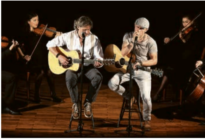
Graceland mir Streichquartett.