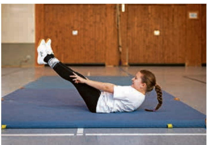
Mit speziellen Übungen werden Kinder spielerisch zu mehr Bewegung motiviert.

(djd). Kinder bewegen sich weltweit viel zu wenig – das bestätigt der Kindergesundheitsbericht 2024 der Stiftung Kindergesundheit. In Deutschland erreichen nur etwa jedes zehnte Mädchen und jeder fünfte Junge die von der Weltgesundheitsorganisation (WHO) empfohlenen 60 Minuten Bewegung pro Tag. Höchste Zeit, dem Bewegungsmangel den Kampf anzusagen.