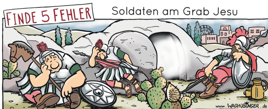
Steckenpferd, Igel, Riesenrad, Taschenlampe, Thermoskanne

mit hundert neuen Samenkörnern. Jesus vergleicht sich selbst mit einem Weizenkorn. Er ist tot, wird ins Grab gelegt. Doch am Ostermorgen lebt er wieder durch Gottes Wirken – neues Leben keimt auf, wie der kleine grüne Halm, der aus der Erde herausguckt. Aber Jesus lebt nicht nur, er bringt auch Frucht. Die Nachricht, dass er den Tod überwunden hat und seine Botschaft von Gottes Liebe zu allen Menschen wird weitergesagt, überall auf der Welt werden Gemeinden gegründet: Zuerst dort, wo Jesus gelebt hat, dann in Afrika, dann in Europa – und irgendwann dann auch hier bei uns. Auch wenn es sich komisch anhört, kann man es so sagen: Wir alle sind die Früchte von Jesus. Wir sind Samenkörner Jesu Christi. Gewachsen, weil er auferstanden ist.