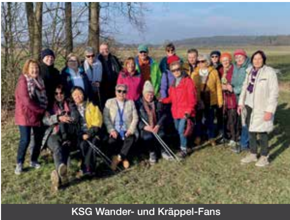
KSG Wander- und Kräppel-Fans

„Auf den Spuren des Wissegickels zum Zwitscherkasten“