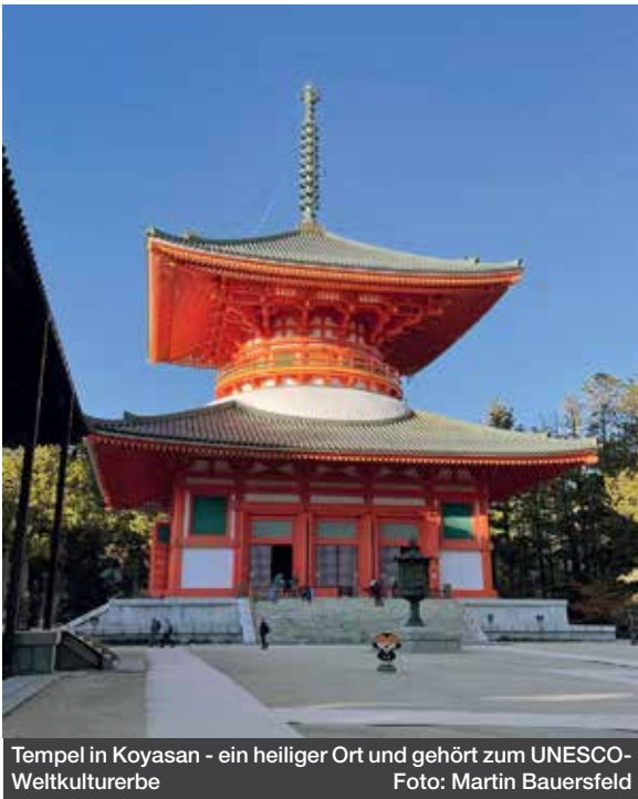
Tempel in Koyasan - ein heiliger Ort und gehört zum UNESCO-Weltkulturerbe