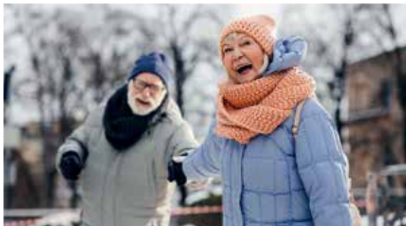
Studien zeigen, dass ein medizinisches Gerät die Leistungsfähigkeit und Lebensqualität von Menschen, die an einer Herzinsuffizienz leiden, deutlich verbessern kann.