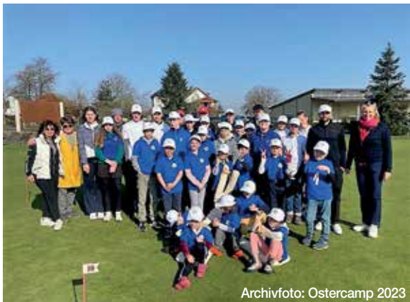
Archivfoto: Ostercamp 2023

Kommt vorbei und lasst euch inspirieren! Florstadt kulturell freut sich auf euren Besuch!