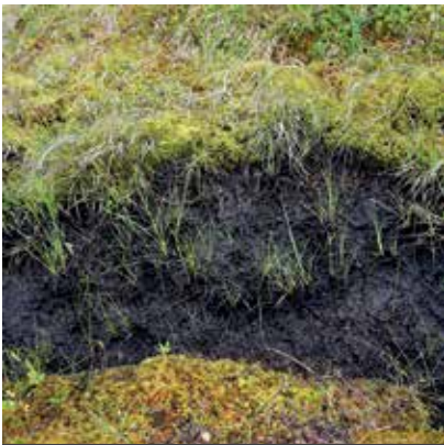
NABU am Freitag

Wie der Erhalt hessischer Moore gelingt! NABU am Freitag am 7. Februar