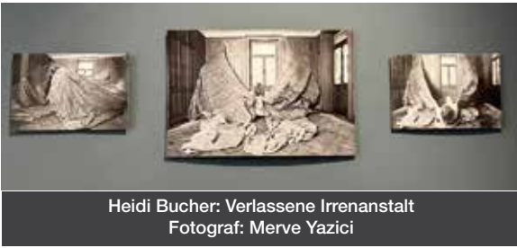
Heidi Bucher: Verlassene Irrenanstalt

Materie und Spuren: Abdrücke des Lebens in der Zeit - Ausstellung noch bis 2. März 2025