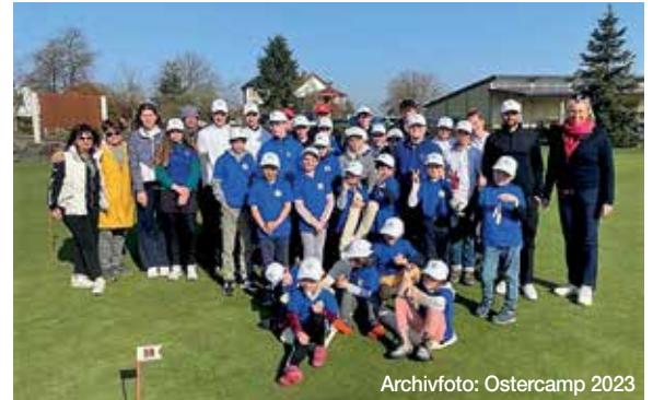
Archivfoto: Ostercamp 2023