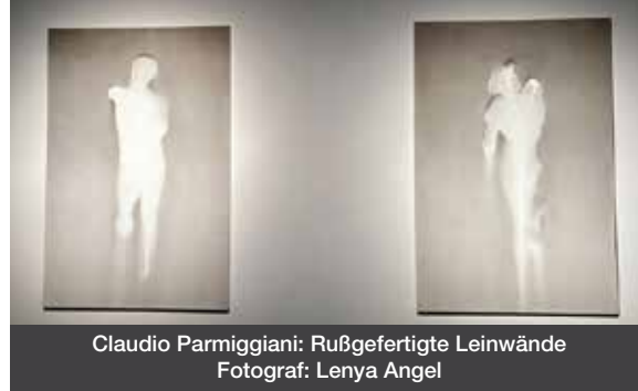
Claudio Parmiggiani: Rußgefertigte Leinwände

ihnen eine sakrale Aura. Die Ausstellung erzählt die Geschichte von Leben und Tod