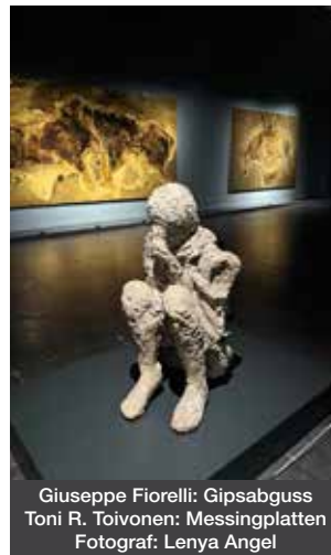
Giuseppe Fiorelli: Gipsabguss Toni R. Toivonen: Messingplatten

Steinernes Haus am Römerberg Markt 44, 60311 Frankfurt/Main www.fkv.de