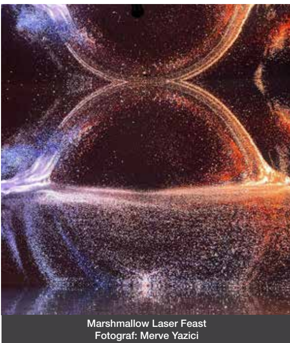
Marshmallow Laser Feast

Redaktion Monatsjournal www.Monatsjournal.de Redaktion@Monatsjournal.de Südstraße 11, 61194 Niddatal