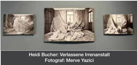
Heidi Bucher: Verlassene Irrenanstalt

Materie und Spuren: Abdrücke des Lebens in der Zeit - Ausstellung noch bis 2. März 2025