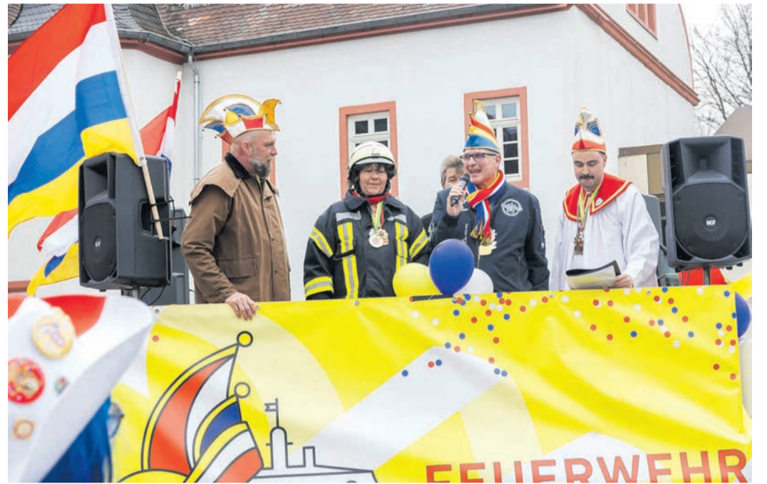
Das närrische Heusenstammer Volk huldigt den neuen Herrschern.