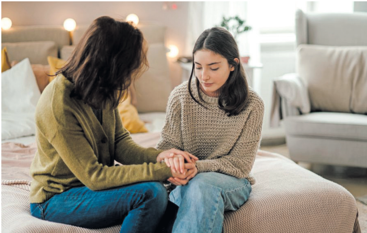
Die seltenen, schweren Blutkrankheiten SCD und TDT beeinträchtigen das Leben der Betroffenen und ihrer Familien erheblich.