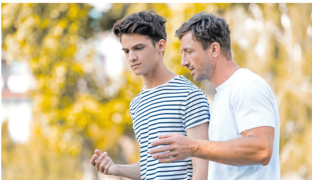
In Deutschland gelten rund 8.000 Erkrankungen als selten, und davon sind etwa 80 Prozent genetisch bedingt.

kann das Blut schlecht fließen und lebenswichtige Organe werden nicht richtig versorgt, was sogenannte Schmerzkrisen hervorrufen kann – das sind starke, manchmal lähmende Schmerzen. Aufgrund der starken Beeinträchtigung der Menschen mit TDT oder SCD und der reduzierten Lebenserwartung sind neue Therapien dringend erforderlich. Unterstützung, Tipps und hilfreiche Informationen finden Betroffene und deren Familien auf findyourbetathalpath.de oder realtalk-sichelzellerkrankheit.de . Hier berichten Menschen mit TDT oder SCD aus ihrem Alltag und wie es ihnen mit den Erkrankungen geht.