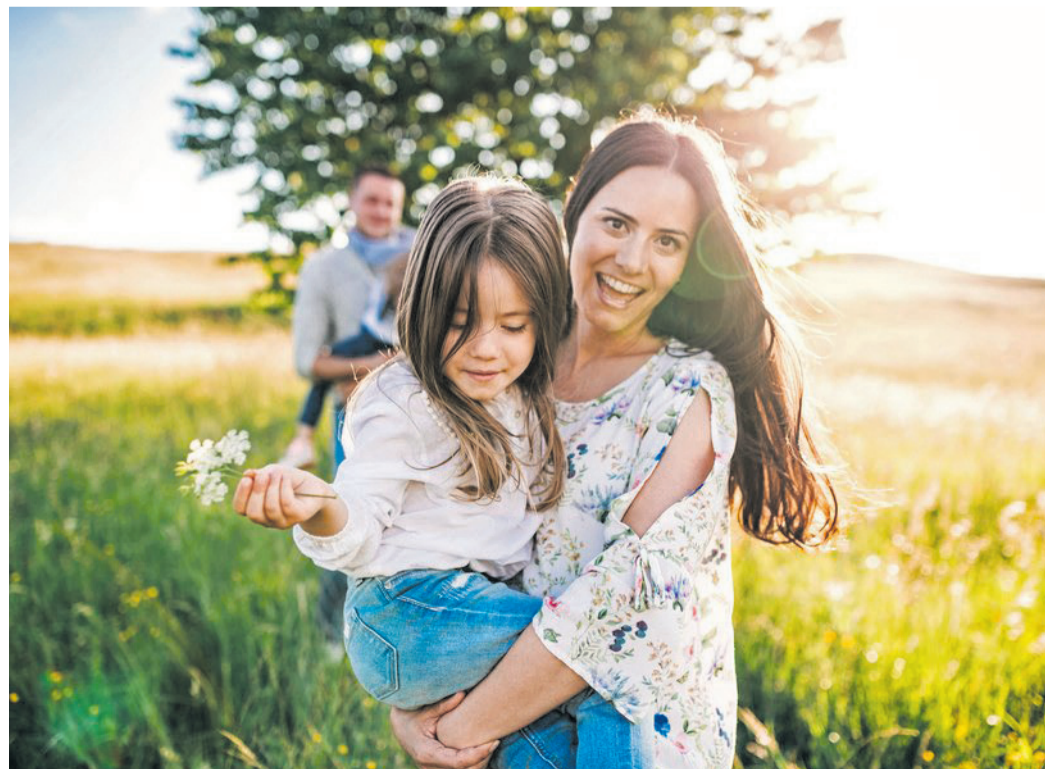
Die Schönheiten des Frühlings und Sommers ohne Allergiebeschwerden genießen - mit schützenden Maßnahmen kann es gelingen.

Die Teilnahmegebühr beträgt elf Euro. Nähere Informationen erhalten Interessierte im Internet unter www.vhs-obertshausen.de oder im Büro der Volkshochschule unter Telefon: 06104 7034114. Die Anmeldung zum Vortrag kann auch direkt über die Internetseite der Volkshochschule erfolgen.