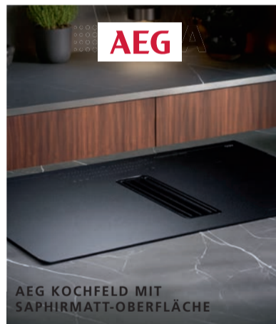
AEG KOCHFELD MIT SAPHIRMATT-OBERFLÄCHE

Erhalten Sie jetzt beim Kauf Ihrer neuen, frei geplanten Küche einen Muldenlüfter der Marke BORA, MIELE, SIEMENS oder AEG im Wert von bis zu 3.499.-€ geschenkt! 3)