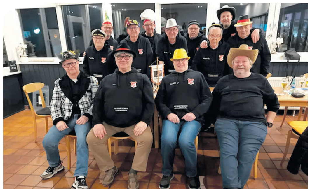
Nach dem Würfeln wird bei den „Alfa Halas“ gefeiert.