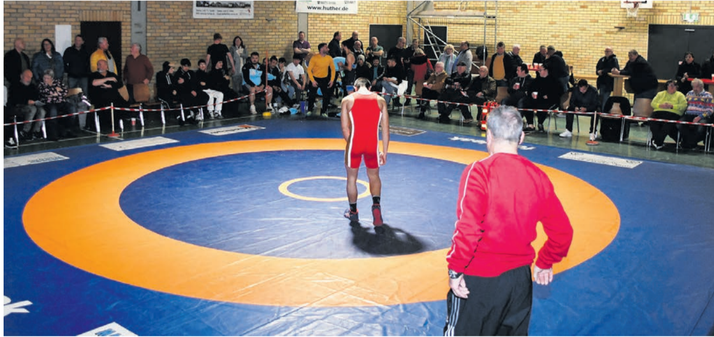
Hängende Köpfe in Münster: In der FSV-Halle (Foto im Rahmen eines Heimkampfs) wird auf unbestimmte Zeit nicht mehr gerungen. 2025 nimmt der Verein keinesfalls am Ligabetrieb teil; die Reaktivierung der vorerst inaktiven Abteilung steht in den Sternen.

Demgegenüber stünden jedoch „steigende Kosten“. Samoschkoff führt ein Beispiel aus der