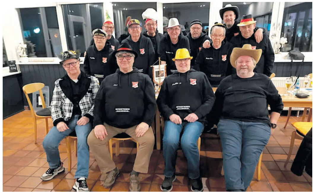
Nach dem Würfeln wird bei den „Alfa Halas“ gefeiert.

vielen Jahrzehnten eine aktive Tennisabteilung, angegliedert an den TAV. Auf vier ganzjährig bespielbaren Granulat-Plätzen können sich Hobbysportler aller Altersgruppen austoben. Selbst wer bisher noch nie mit dieser Sportart in Berührung gekommen ist, ist herzlich eingeladen, einen Schnuppertermin zu vereinbaren und sich einfach mal darin zu versuchen. Eine unverbindliche Schnuppermitgliedschaft kostet 70 Euro für ein Jahr. Weitere Informationen unter www.tav-tennis.de .