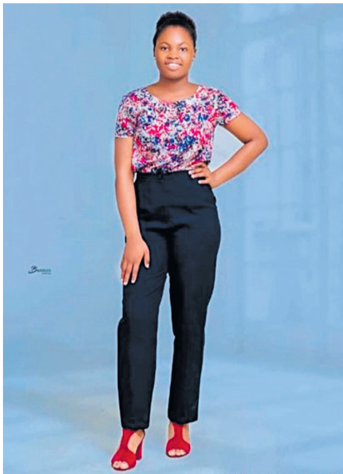
Nach ihrem Abschluss wird die geförderte Studentin als Ärztin in ihrer Heimatregion tätig sein und dringend benötigte medizinische Versorgung leisten.