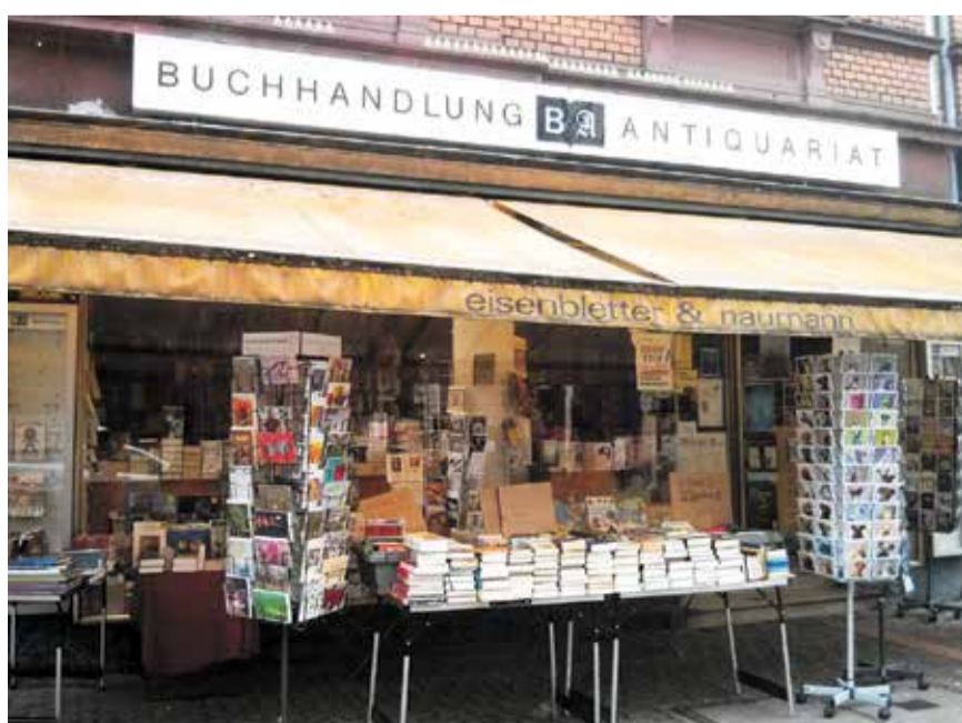
Der Eingangsbereich der Buchhandlung

Zustellhotline: Tel. 06104-4970-0 Mo. – Fr. 8.00 – 16.30 Uhr