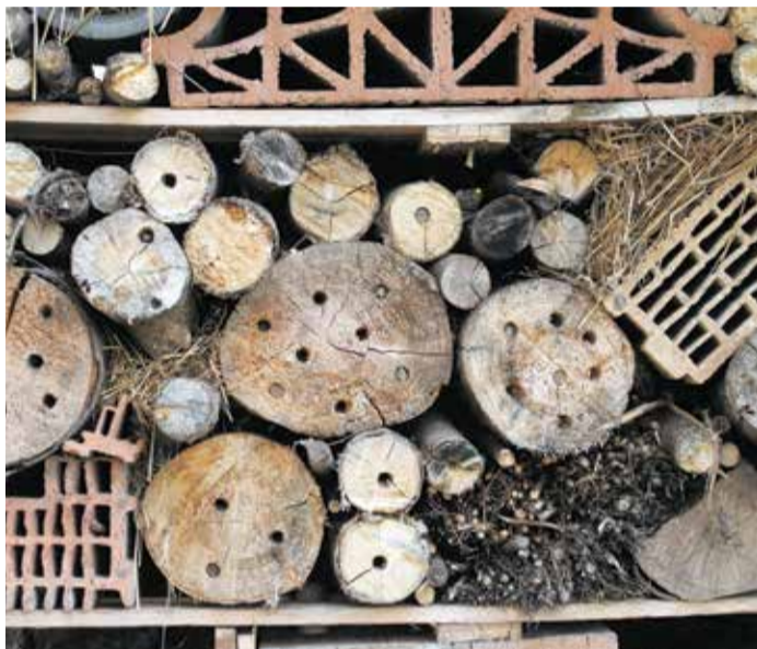
Insektenhotels sind eine gute Möglichkeit, um verschiedene Arten zu unterstützen.

Weitere Informationen finden Interessierte unter frankfurt.de/artenschutz