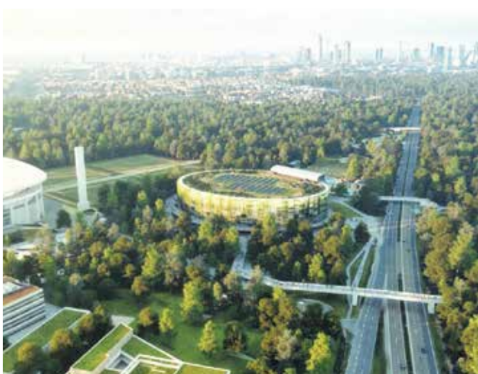
ABBILDUNG: RENDERING AUSSEN-ANSICHT TAGSÜBER