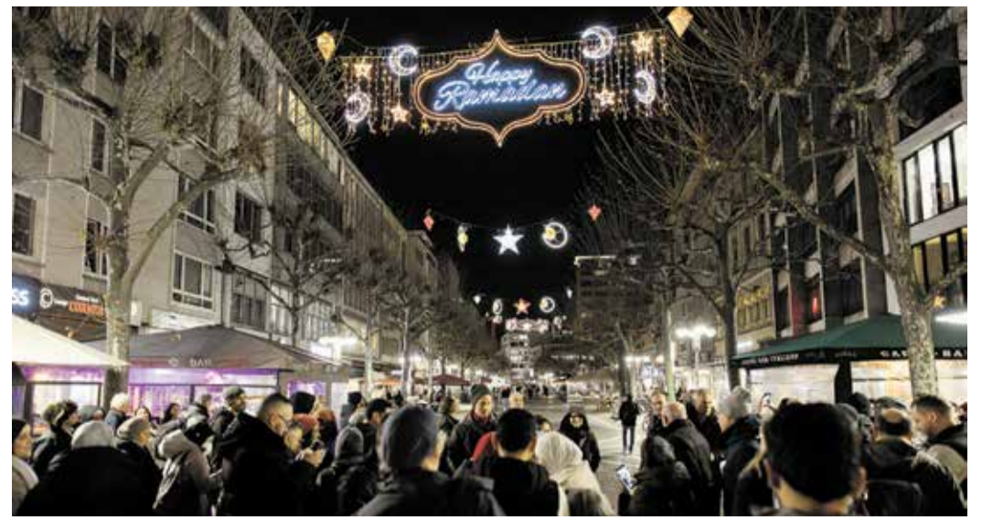
Für vier Wochen wird die Große Bockenheimer Straße nun mit Halbmonden, Sternen und Fanoos-Laternen sowie dem Schriftzug „Happy Ramadan“ beleuchtet.