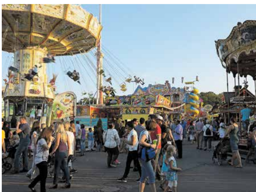
Die Dippemess bringt den Festplatz zum Beben