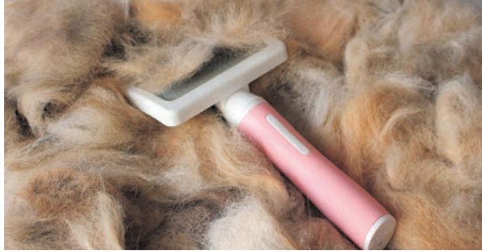
Hundehaare können in der freien Natur tödlich werden für Vögel, die sie zum Nestbau benutzen. Die Tierschutzbeauftragte des Kreises rät deshalb, die Vierbeiner zuhause zu bürsten und die Haare zu entsorgen.

Darmstadt-Dieburg (EA) Die Tierschutzbeauftragte des Landkreises Darmstadt-Dieburg, Dr. Christa Wilczek, warnt vor Hundehaaren, die für den Nachwuchs von Vögeln tödlich sein können. Gleichzeitig ruft sie Hundebesitzer dazu auf, ihre Tiere nicht in der freien Natur auszukämmen – oder, falls die Vierbeiner doch dort gebürstet werden – die Haare einzusammeln und sie zuhause in der Restmülltonne zu entsorgen. Anlass für diesen Appell ist eine Studie der Universität Sussex in England, bei der in Vogelnestern Insektizide nachgewiesen wurden, die auch in Deutschland in gängigen Produkten verwendet werden und auch im Onlinehandel verfügbar sind. Es handelt sich um Produkte zur Bekämpfung von Flöhen und Zecken, „insbesondere bei Hunden und Katzen mittels Halsbänder oder Spot-on-Präparaten“, erklärt Wilczek. „Bei den untersuchten Stoffen - Fipronil und Imidacloprid - handelt es sich um Nervengifte, die über die poröse Eischale die Embryoentwicklung negativ beeinflussen oder auch den geschlüpften nackten Nesthocker schädigen.“ Laut Studie befand sich Fipronil in allen Nestern und Imidacloprid in fast 90 Prozent der Nester. „Viele Vogeleltern