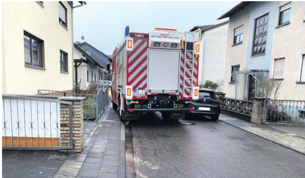
Mit öffentlichkeitswirksamen Aktionen wie dieser soll Bewusstsein dafür geschaffen werden, der Feuerwehr den Platz einzuräumen, den sie benötigt.

achten. Straftzettel wurden bei der Kontrollfahrt nicht verteilt. Die allermeisten Menschen stellen sich nicht absichtlich so hin, dass für die Feuerwehr kein Durchkommen ist. Viele denken einfach