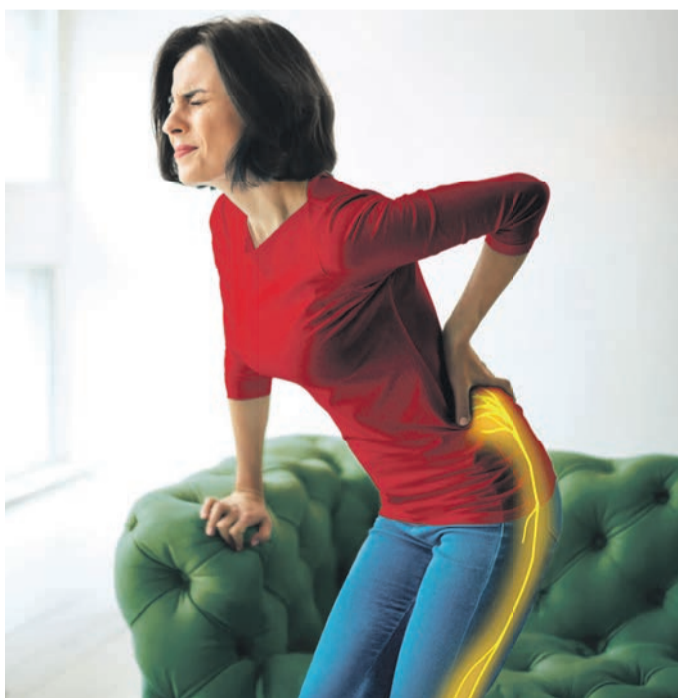
Der Ischiasnerv kann bis zu 40.000 Nervenfasern enthalten, die Informationen zwischen dem Gehirn und den Beinen transportieren.

Aus medizinischer Sicht ist es wichtig, für eine erfolgreiche Behandlung direkt an den Nervenschmerzen anzusetzen. Überraschend: Bei Nervenschmerzen zeigen viele Schmerzmittel nur wenig Wirkung, denn sie bekämpfen meist Entzündungen. Anders die Schmerzmittel Restaxil, die speziell zur Behandlung von Nervenschmerzen, wie z. B. bei einer Ischialgie, entwickelt wurden. So wird etwa der Arzneistoff Iris versicolor in Restaxil laut Arzneimittelbild vor allem bei Ischialgien mit ziehenden, reißennden und brennenden Schmerzen im Hüftnerve bis zum Fuß eingesetzt. Nicht weniger eindrucksvoll wirkt Cimicifuga racemosa : Der Arzneistoff kommt erfolgreich