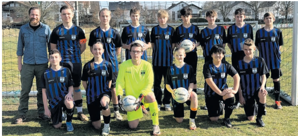
Die C-Jugend bedankt sich ganz herzlich für die neuen Fußballbälle bei der Firma Solidtec.