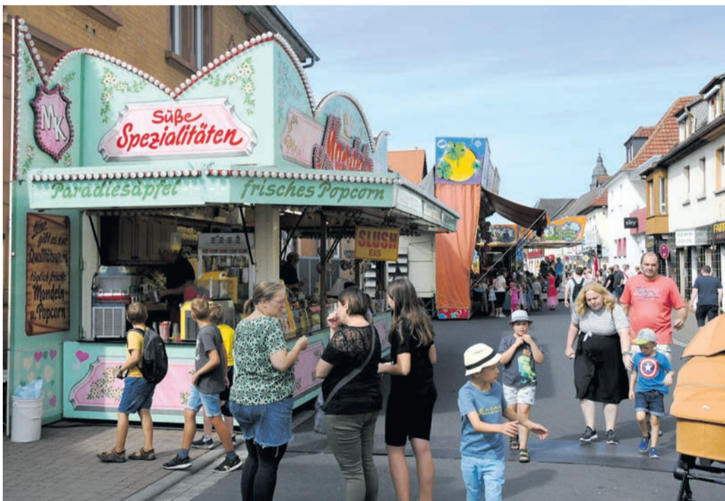
Die Frankfurter Straße als wichtigster Nord-Süd-Route in Münster wurde zur Kerb bisher drei Tage lang voll gesperrt. Durch den geplanten Wechsel auf den Abtenauer Platz würde dies überflüssig.