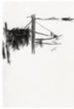
Abb. 9, Seite 14 O.T. (Klosterwald) 19.06.2017 1 Zeichenkohle, Büttenkarton Ca. 78,6 x 53,25 cm