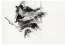
Abb. 6, Seite 6 O.T. (Klosterwald) 02.06.2017 Zeichenkohle, Zeichenkarton Ca. 38,5 x 56 cm