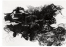
Abb. /1, Seite 36 O.T. (Klosterwald) 24.06.2015 Zeichenkohle, Zeichenkarton 42 x 59,4 cm