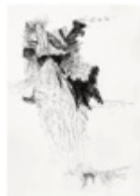
Abb. 32, Seite 21 O.T. (Klosterwald) 07.09.2017 Zeichenkohle, Büttenskarton Ca. 78,5 x 54,5 cm