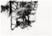
Abb. 1, Seite 5 O.T. (Klosterwald) 26.05.2017 Zeichenkohle, Zeichenkarton Ca. 38,5 x 56 cm