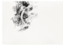
Abb. /2, Seite 19 O.T. (Lämmerspieler Wald) 02.07.2015 Zeichenkohle, Zeichenkarton 42 x 59,4 cm