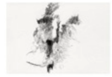
Abb. /11, Seite 34 O.T. (Siran) 03.05.2017 Zeichenkohle, Zeichenkarton 38,5 x 56 cm