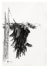
Abb. 45, Seite 25 O.T. (Klosterwald) 02.12.2017 1 Zeichenkohle, Bütttenkarton Ca. 78 x 55 cm