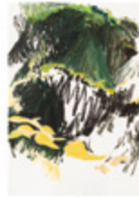
Abb. 72, Seite 36 O.T. (Klosterwald) 02.05.2018 1 Ölstifte, Konservierungskarton 80 x 55 cm