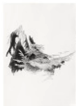
Abb. 53, Seite 24 O.T. (Klosterwald) 01.02.2018 1 Zeichenkohle, Bütttenkarton Ca. 78,6 x 55 cm