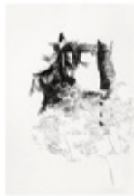
Abb. 12, Seite 10 O.T. (Klosterwald) 21.06.2017 Zeichenkohle, Büttenkarton Ca. 78,7 x 53,1 cm