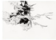
Abb. /8, Seite 10 O.T. (Klosterwald) 12.08.2015 Zeichenkohle, Zeichenkarton 42 x 59,4 cm