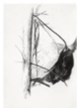
Abb. 50, Seite 26 O.T. (Klosterwald) 11.01.2018 1 Zeichenkohle, Bütttenkarton Ca. 78,8 x 55 cm