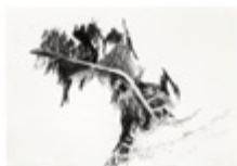
Abb. 51, Seite 37 O.T. (Klosterwald) 26.01.2018 Zeichenkohle, Bütttenpapier 54,6 x 78,5 cm