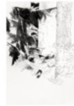
Abb. 14, Seite 17 O.T. (Klosterwald) 26.06.2017 1 Zeichenkohle, Büttenkarton Ca. 78,5 x 54,7 cm