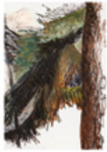
Abb. 62, Seite 13 O.T. (Klosterwald) 21.03.2018 Ölstifte, Konservierungskarton 80 x 55 cm