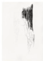
Abb. 49, Seite 39 O.T. (Klosterwald) 23.12.2017 1 Zeichenkohle, Bütttenkarton Ca. 78,8 x 55 cm