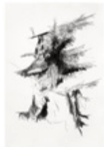
Abb. 28, Seite 18 O.T. (Klosterwald) 16.08.2017 Zeichenkohle, Büttenskarton Ca. 78,5 x 54,8 cm