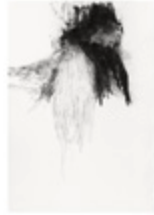
Abb. 30, Seite 34 O.T. (Klosterwald) 05.09.2017 Zeichenkohle, Büttenskarton Ca. 78,7 x 54,8 cm