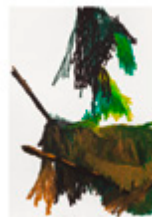
Abb. 56, Seite 22 O.T. (Klosterwald) 23.02.2018 Ölstifte, Konservierungskarton 80 x 55 cm