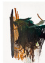
Abb. 57, Seite 33 O.T. (Klosterwald) 06.03.2018 1 Ölstifte, Konservierungskarton 80 x 55 cm