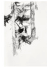
Abb. 16, Seite 9 O.T. (Klosterwald) 03.07.2017 Zeichenkohle, Büttenkarton Ca. 78,5 x 54,8 cm