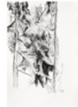
Abb. 20, Seite 12 O.T. (Klosterwald) 18.07.2017 Zeichenkohle, Büttenkarton Ca. 78,5 x 55 cm