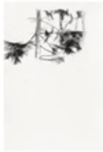
Abb. 8, Seite 15 O.T. (Klosterwald) 09.06.2017 1 Zeichenkohle, Büttenkarton Ca. 78,8 x 54,7 cm