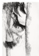
Abb. 55, Seite 28 O.T. (Klosterwald) 21.02.2018 1 Zeichenkohle, Bütttenkarton Ca. 78,8 x 55 cm