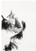
Abb. 29, Seite 25 O.T. (Klosterwald) 17.08.2017 Zeichenkohle, Büttenskarton Ca. 78,8 x 54,6 cm