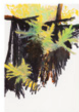
Abb. 69, Seite 31 O.T. (Klosterwald) 17.04.2018 1 Ölstifte, Konservierungskarton 80 x 55 cm