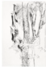
Abb. 13, Seite 13 O.T. (Klosterwald) 24.06.2017 Zeichenkohle, Büttenkarton Ca. 78,5 x 54,8 cm