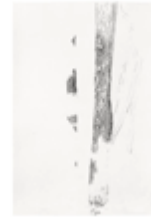
Abb. 15, Seite 16 O.T. (Klosterwald) 27.06.2017 Zeichenkohle, Büttenkarton Ca. 78,5 x 55 cm