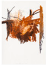
Abb. 64, Seite 14 O.T. (Klosterwald) 27.03.2018 Ölstifte, Konservierungskarton 80 x 55 cm