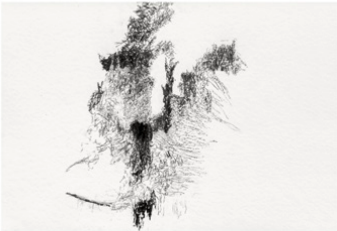
Abb. /10: 02.05.2017, Siran Abb. /11: 03.05.2017, Siran Abb. 30: 05.09.2017