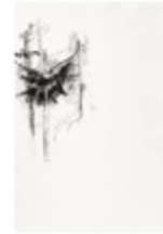
Abb. 17, Seite 11 O.T. (Klosterwald) 04.07.2017 Zeichenkohle, Büttenkarton Ca. 78,6 x 54,5 cm