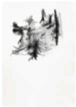
Abb. 24, Seite 13 O.T. (Klosterwald) 06.08.2017 Zeichenkohle, Büttenskarton Ca. 78,7 x 55 cm