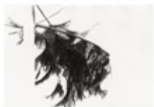
Abb. 42, Seite 23 O.T. (Klosterwald) 23.11.2017 1 Zeichenkohle, Bütttenkarton Ca. 54,9 x 78,57 cm