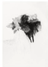
Abb. 31, Seite 35 O.T. (Klosterwald) 06.09.2017 Zeichenkohle, Büttenskarton Ca. 78,5 x 54,5 cm