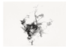
Abb. /6, Seite 18 O.T. (Lämmerspieler Wald) 03.08.2015 Zeichenkohle, Zeichenkarton 42 x 59,4 cm