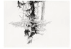
Abb. /9, Seite 10 O.T. (Klosterwald) 13.08.2015 Zeichenkohle, Zeichenkarton 42 x 59,4 cm