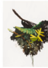
Abb. 70, Seite 31 O.T. (Klosterwald) 24.04.2018 Ölstifte, Konservierungskarton 80 x 55 cm