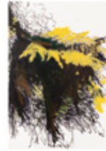
Abb. 76, Seite 4 O.T. (Klosterwald) 26.05.2018 1 Ölstifte, Konservierungskarton 80 x 55 cm