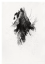
Abb. 44, Seite 37 O.T. (Klosterwald) 01.12.2017 1 Zeichenkohle, Bütttenkarton Ca. 78 x 54,8 cm