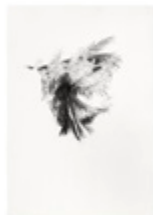
Abb. 27, Seite 19 O.T. (Klosterwald) 09.08.2017 Zeichenkohle, Büttenskarton Ca. 78,5 x 54,8 cm