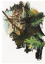
Abb. 68, Seite 11 O.T. (Klosterwald) 11.04.2018 1 Ölstifte, Konservierungskarton 80 x 55 cm