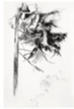
Abb. 11, Seite 8 O.T. (Klosterwald) 21.06.2017 Zeichenkohle, Büttenkarton Ca. 78,7 x 53,3 cm