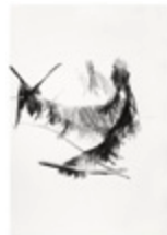
Abb. 35, Seite 21 O.T. (Klosterwald) 16.10.2017 Zeichenkohle, Büttenskarton Ca. 78,5 x 54,7 cm