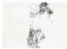
Abb. /3, Seite 18 O.T. (Lämmerspieler Wald) 04.07.2015 Zeichenkohle, Zeichenkarton 42 x 59,4 cm