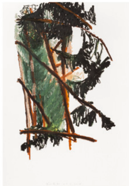
Abb. 69: 17.04.2018 1 Abb. 70: 24.04.2018 Abb. 65: 29.03.2018