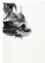
Abb. 37, Seite 21 O.T. (Klosterwald) 18.10.2017 Zeichenkohle, Büttenskarton Ca. 78,5 x 54,7 cm