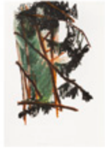
Abb. 65, Seite 31 O.T. (Klosterwald) 29.03.2018 Ölstifte, Konservierungskarton 80 x 55 cm