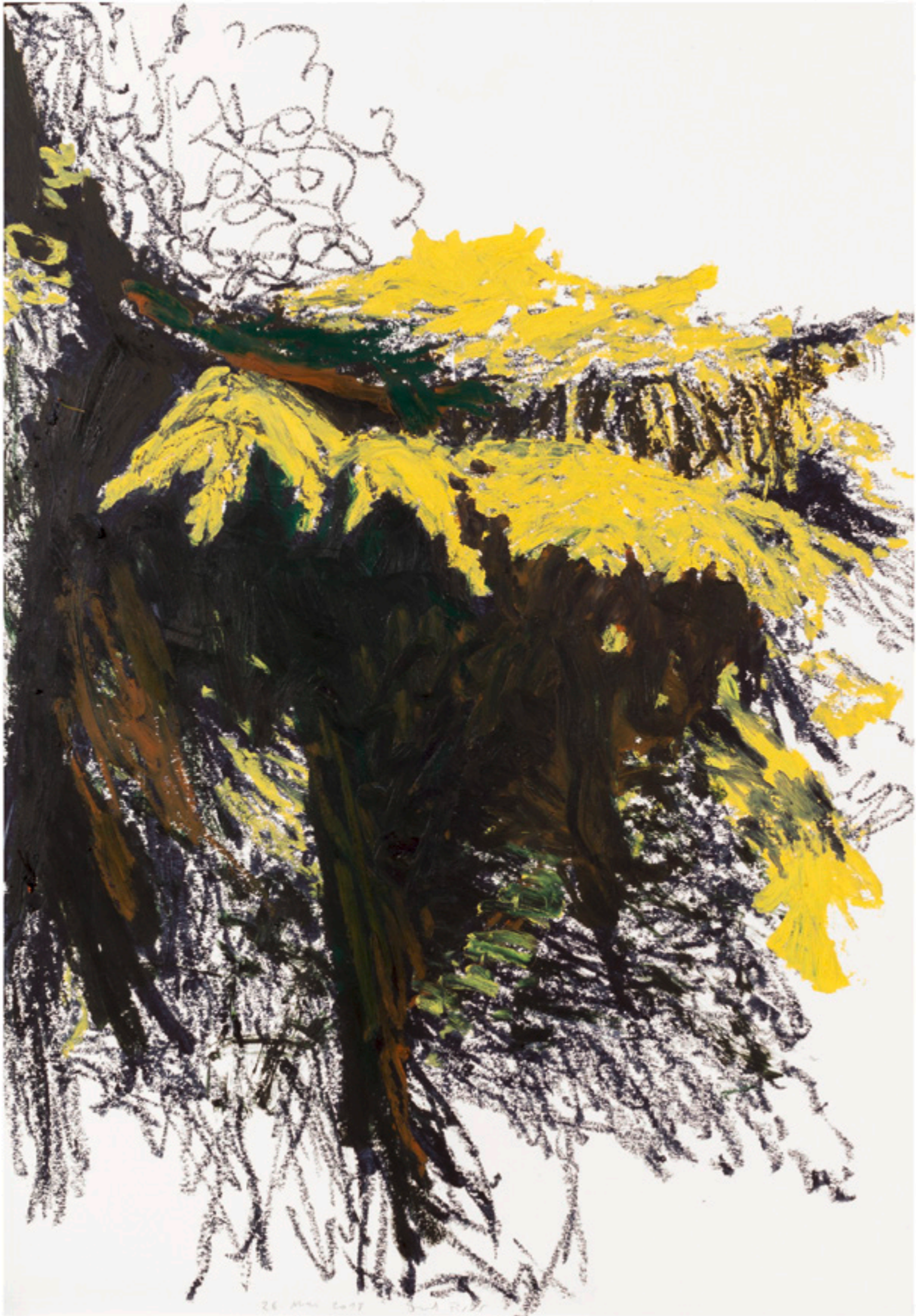
Abb. 76: 26.05.2018'