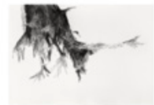
Abb. 39, Seite 21 O.T. (Klosterwald) 26.10.2017 Zeichenkohle, Büttenskarton Ca. 54,8 x 78,6 cm