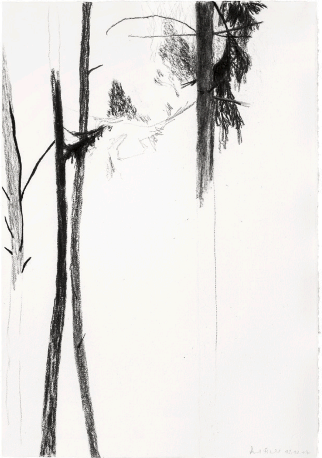
Abb. 48: 13.12.2017 1