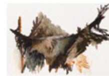
Abb. 59, Seite 29 O.T. (Klosterwald) 14.03.2018 Ölstifte, Konservierungskarton 55 x 80 cm