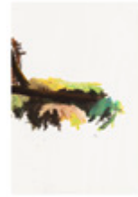
Abb. 77, Seite 40 O.T. (Klosterwald) 29.05.2018 1 Ölstifte, Konservierungskarton 80 x 55 cm