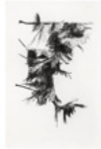
Abb. 10, Seite 9 O.T. (Klosterwald) 20.06.2017 1 Zeichenkohle, Büttenkarton Ca. 78,7 x 53,3 cm