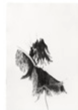
Abb. 41, Seite 23 O.T. (Klosterwald) 15.11.2017 Zeichenkohle, Büttenskarton Ca. 78,6 x 54,8 cm