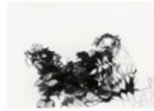
Abb. /5, Seite 36 O.T. (Lämmerspieler Wald) 25.07.2015 Zeichenkohle, Zeichenkarton 42 x 59,4 cm