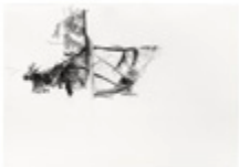
Abb. 23, Seite 38 O.T. (Klosterwald) 05.08.2017 1 Zeichenkohle, Büttenskarton Ca. 55 x 78,8 cm