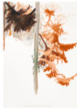
Abb. 63, Seite 8 O.T. (Klosterwald) 26.03.2018 Ölstifte, Konservierungskarton 80 x 55 cm