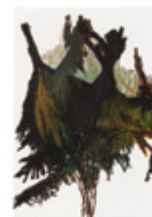
Abb. 58, Seite 32 O.T. (Klosterwald) 13.03.2018 Ölstifte, Konservierungskarton 80 x 55 cm