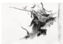
Abb. 47, Seite 22 O.T. (Klosterwald) 07.12.2017 Zeichenkohle, Bütttenkarton Ca. 54,8 x 78,6 cm