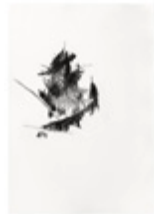
Abb. 33, Seite 37 O.T. (Klosterwald) 25.09.2017 Zeichenkohle, Büttenskarton Ca. 78,8 x 55 cm