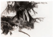
Abb. 4, Seite 6 O.T. (Klosterwald) 31.05.2017 1 Zeichenkohle, Zeichenkarton Ca. 38,5 x 56 cm