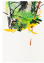
Abb. 71, Seite 25 O.T. (Klosterwald) 28.04.2018 Ölstifte, Konservierungskarton 80 x 55 cm