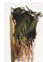
Abb. 61, Seite 32 O.T. (Klosterwald) 19.03.2018 Ölstifte, Konservierungskarton 80 x 55 cm