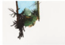
Abb. 67, Seite 15 O.T. (Klosterwald) 07.04.2018 Ölstifte, Konservierungskarton 55 x 80 cm