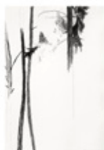
Abb. 48, Seite 27 O.T. (Klosterwald) 13.12.2017 1 Zeichenkohle, Bütttenkarton Ca. 78,5 x 54,8 cm