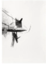
Abb. 26, Seite 40 O.T. (Klosterwald) 08.08.2017 Zeichenkohle, Büttenskarton Ca. 78,7 x 54,6 cm