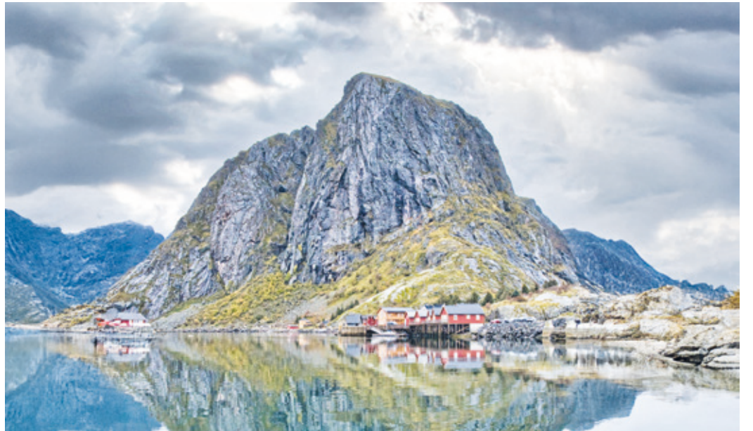
Blick auf die roten Rorbuer (Fischerhütten) von Hamnøy – eines der vielen Fotomotive auf den Lofoten.