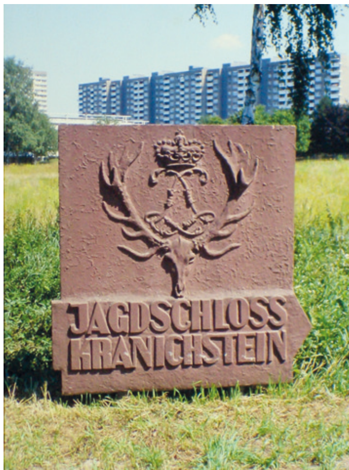
Foto des Wegweisers am Eingang zu Kranichstein, wohl aus den 70er/80er Jahren, jedenfalls noch ohne Lidl.