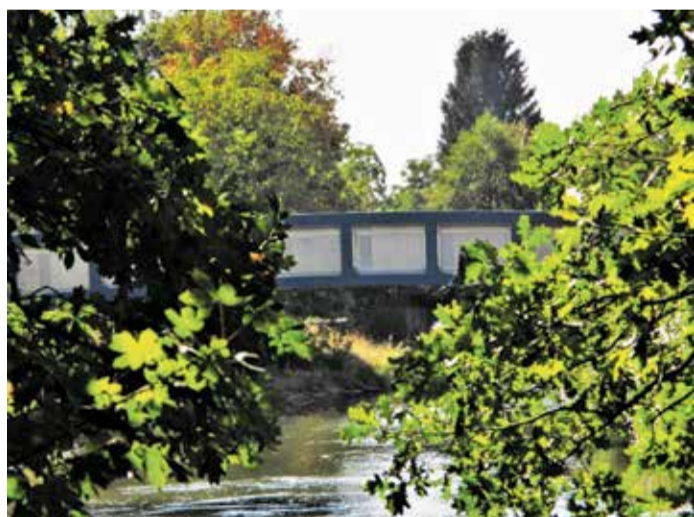
Solmspark – Blick auf den Blauen Steg

Rödelheim kann nicht nur Grün, sondern auch Ebbelwei! In der Frankfurter Apfelwein Botschaft dreht sich alles um das Kultgetränk der Stadt. Hier gibt's nicht nur den klassischen Schoppen, sondern auch außergewöhnliche Apfelweinsorten und hessische Spezialitäten. Urig, gesellig und mit viel Liebe zum Handwerk – genau so muss Apfelwein sein. Wer mehr über das Traditionsgetränk erfahren will, kann sich