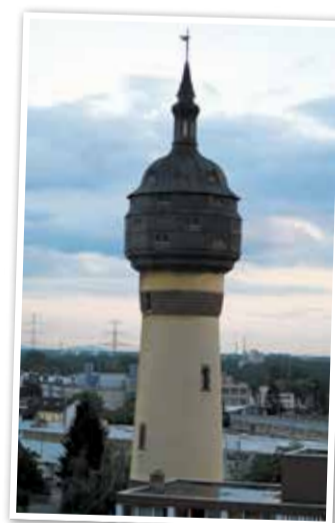
Der alte Wasserturm.