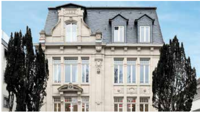
Das StattHaus Offenbach.