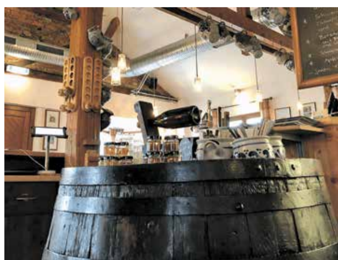
Der Innenraum der Botschaft.

Zustellhotline: Tel. 06104-4970-0 Mo. – Fr. 8.00 – 16.30 Uhr