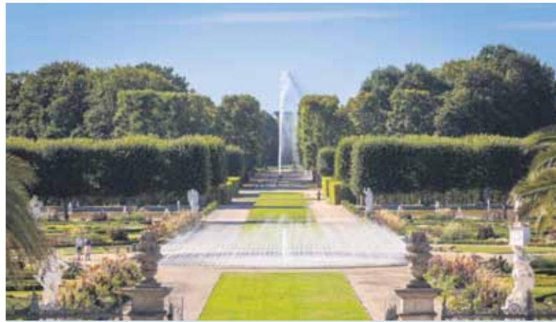
Der Große Garten in Hannover-Herrenhausen ist ein barockes Gesamtkunstwerk von Weltrang.

(DJD). In Hannover geben sich die Weltstars sozusagen das Mikro in die Hand: Robbie Williams, Billie Eilish und Linkin Park stehen in diesem Jahr auf dem Programm der rund 450 Großkonzerte. Und nicht zuletzt spielen die Scorpions in ihrer Heimatstadt Hannover zum 60-jährigen Bandjubiläum das einzige Deutschlandkonzert, zusammen mit Alice Cooper und Judas Priest. Doch dass die niedersächsische Landeshauptstadt ihr zehnjähriges Jubiläum als UNESCO City of Music feiert und sich als Eventstadt einen Namen macht, liegt nicht allein an internationalen Gaststars, sondern auch am ganzjährigen Kulturprogramm und an alljährlichen Festivals. Da werden