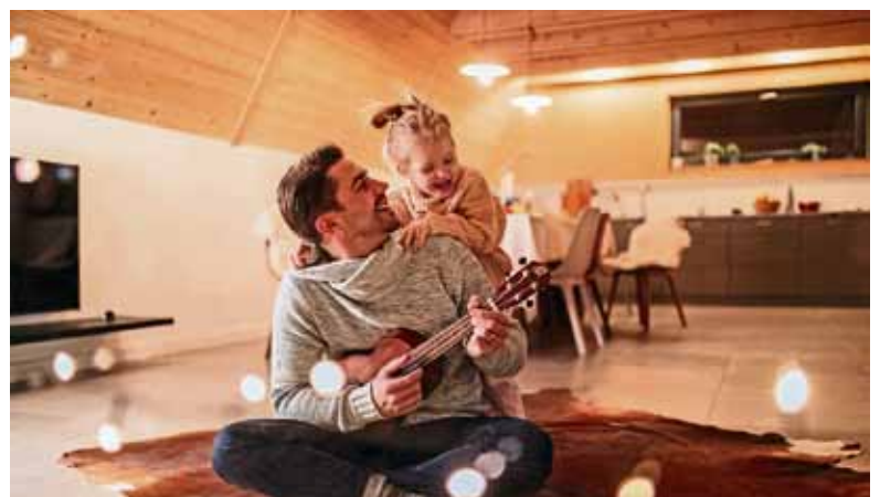
Sicher und flexibel: Verbraucherinnen und Verbraucher können heute bei der Stromversorgung aus verschiedenen Tarifvarianten auswählen.