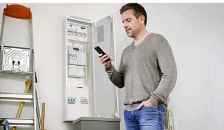
Die Energiewelt von morgen wird dezentraler und digitaler. Mit dem Einsatz intelligenter Stromzähler, den sogenannten Smart Meter, eröffnen sich neue Möglichkeiten der Flexibilisierung.

Ein entscheidender Baustein für die Flexibilisierung des Energiesystems und wichtiges Element für moderne Tarife sind Smart Meter. Die digitalen Zähler messen und übertragen den Stromverbrauch automatisch an den Netzbetreiber und Energieversorger und zeigen in Echtzeit, wie hoch der Strombedarf und -erzeugung gerade sind. Dadurch haben Haushalte ihren Verbrauch besser im Blick und können in Kombination mit passenden Apps Stromfresser künftig leichter identifizieren. Kunden mit Verbräuchen über 6.000 kWh, mit eigener Solaranlage auf dem Dach oder mit steuerbaren Verbrauchseinrichtungen wie Wallboxen, bekommen sukzessive die intelligenten Zähler eingebaut. Das übernimmt in der Regel der örtliche Netzbetreiber.