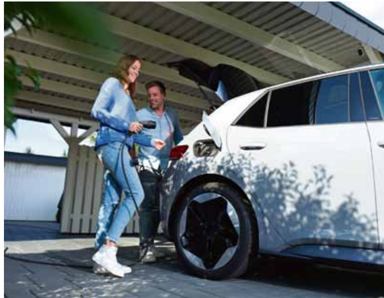
Flexible Stromtarife bieten für Fahrer von E-Autos bereits heute konkrete Vorteile.

Mit den flexiblen Tarifen aus der Kategorie Home & Drive etwa bietet E.ON als einer der ersten Energieversorger bundesweit ein Angebot, das optimal auf die Bedürfnisse von E-Mobilisten zugeschnitten ist: Der Kunde verbindet das E-Auto wie gewohnt mit der Wallbox zu Hause, die benötigte Lademenge sowie die Zeitpunkte für eine möglichst günstige Aufladung im Laufe der Nacht werden von E.ON gemanagt und der Ladevorgang somit optimiert. Am nächsten Morgen steht das Fahrzeug pünktlich mit dem gewünschten Ladezustand bereit.