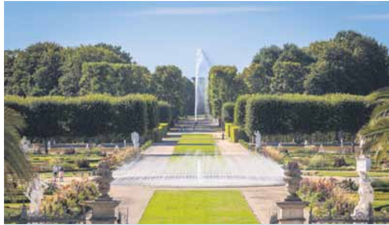
Der Große Garten in Hannover-Herrenhausen ist ein barockes Gesamtkunstwerk von Weltrang.

(DJD). In Hannover geben sich die Weltstars sozusagen das Mikro in die Hand: Robbie Williams, Billie Eilish und Linkin Park stehen in diesem Jahr auf dem Programm der rund 450 Großkonzerte. Und nicht zuletzt spielen die Scorpions in ihrer Heimatstadt Hannover zum 60-jährigen Bandjubiläum das einzige Deutschlandkonzert, zusammen mit Alice Cooper und Judas Priest. Doch dass die niedersächsische Landeshauptstadt ihr zehnjähriges Jubiläum als UNESCO City of Music feiert und sich als Eventstadt einen Namen macht, liegt nicht allein an internationalen Gaststars, sondern auch am ganzjährigen Kulturprogramm und an alljährlichen Festivals. Da werden