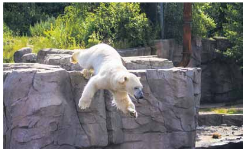
Zum 160. Jubiläum hat der Erlebnis-Zoo Hannover einen Publikumspreis gewonnen.

Der Erlebnis-Zoo Hannover hat zu seinem 160. Geburtstag gerade den zweiten Platz im Publikums-Award „Bester Zoo Deutschlands“ gewonnen, laut einer großen Umfrage des Freizeitportals parkscout.de. Besondere Publikumsbeliebte und populäre Fotomotive sind auch die Nanas, die bunten Frauenfiguren von Niki de Saint Phalle mitten in der Stadt am Ufer der Leine. Ab September zeigt das Sprengel Museum Hannover in der Ausstellung „Love you for Infinity“ viele weitere Werke der französischen Künstlerin, neben international gefeierter japanischer Kunst von Yayoi Kusama und Takashi Murakami. Und abends nach den Besichtigungen ist es an der Zeit, Hannovers Nachtleben in Roof-Top-Bars und coolen Clubs zu erkunden.