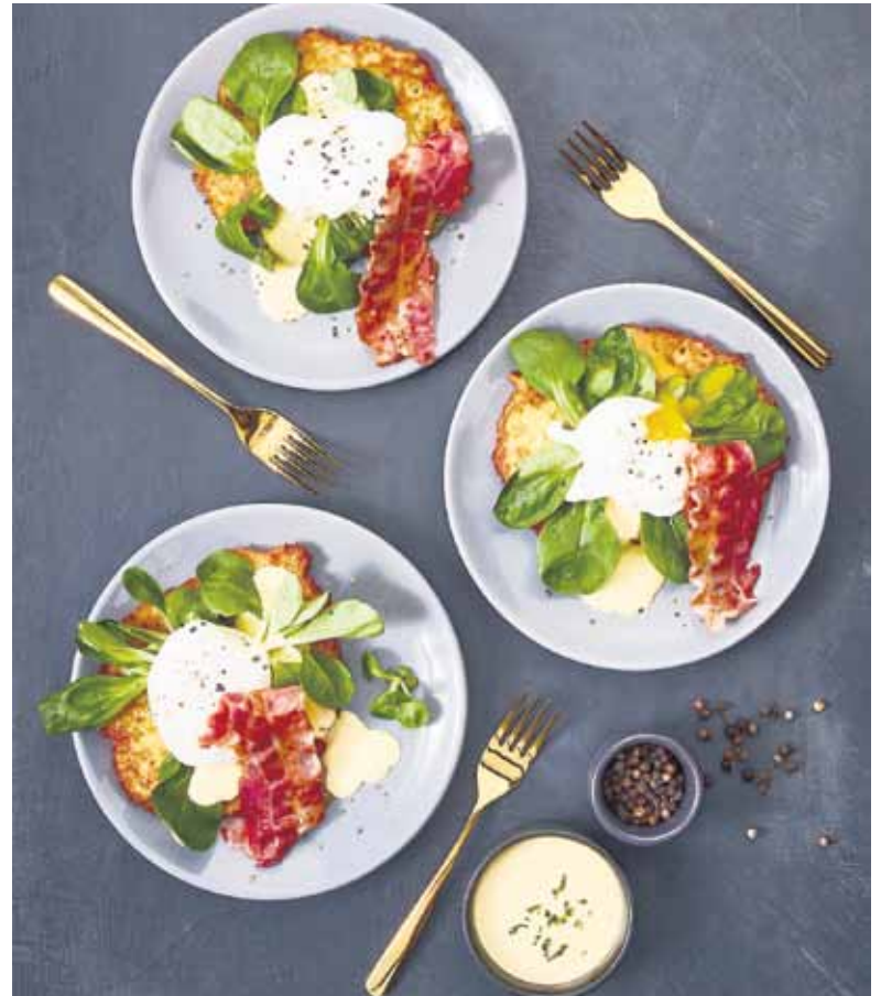
Dieses leckere Frühstücksrezept ist schnell gemacht und sättigt gut.

Die Reibekuchen nach Packungsanweisung zubereiten, also entweder in der Pfanne, im Backofen oder ganz praktisch in der Heißluftfritteuse. Fertige Küchlein mit Feldsalat belegen. Den Bacon in der Pfanne ausbraten, bis er knusprig ist. Für die Eggs Benedict das Wasser in einem flachen Topf aufkochen und den Essig hineingeben. Jedes Ei einzeln in eine Tasse aufschlagen. Hitze etwas herunterschalten, mit einem Kochlöffel das Wasser schnell umrühren, sodass ein Strudel entsteht, in diesen das Ei aus der Tasse vorsichtig hineingleiten lassen. Rund 3 Minuten garen, dann mithilfe einer Schaumkelle das Ei auf dem Salat platzieren. Mit Sauce Hollandaise beklecksen und mit den Tomatenwürfel und der Petersilie bestreuen. Den knusprigen Bacon zuoberst auflegen. Auf www.pahmeyer.com finden Frühstücksfreunde noch weitere leckere Rezeptideen zum kostenlosen Download.