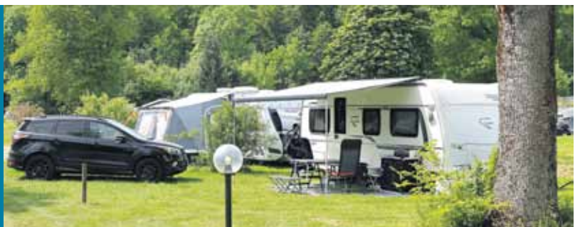
In Deutschland gibt es über 3.100 Campingplätze. Mehr dazu auf Seite 2.