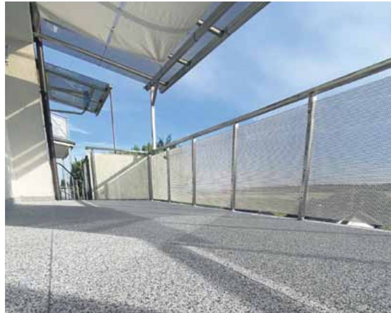
Neuer Glanz für ältere Balkone: Eine Sanierung des Belags wertet den Außenbereich sichtbar auf.

Die alten Platten mühsam wegschlagen, den Untergrund vorbereiten und abdichten, danach den neuen Bodenaufbau ausbringen: Mit einer Balkonverschönerung sind häufig viele zeitintensive Arbeitsschritte verbunden. Deutlich schneller geht es mit Sanierungs-