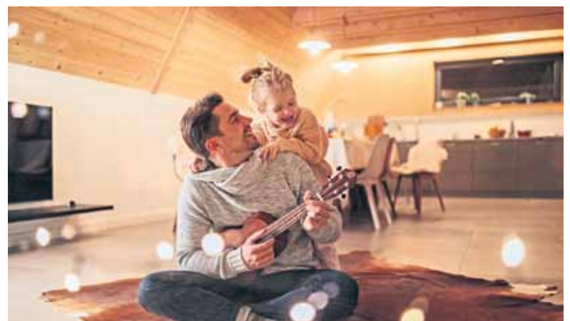
Sicher und flexibel: Verbraucherinnen und Verbraucher können heute bei der Stromversorgung aus verschiedenen Tarifvarianten auswählen.