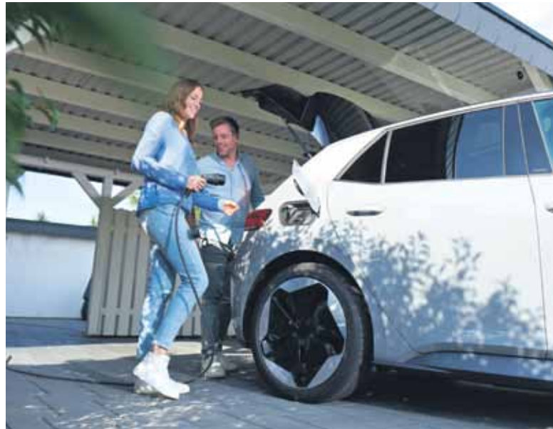
Flexible Stromtarife bieten für Fahrer von E-Autos bereits heute konkrete Vorteile.

Mit den flexiblen Tarifen aus der Kategorie Home & Drive etwa bietet E.ON als einer der ersten Energieversorger bundesweit ein Angebot, das optimal auf die Bedürfnisse von E-Mobilisten zugeschnitten ist: Der Kunde verbindet das E-Auto wie gewohnt mit der Wallbox zu Hause, die benötigte Lademenge sowie die Zeitpunkte für eine möglichst günstige Aufladung im Laufe der Nacht werden von E.ON gemanagt und der Ladevorgang somit optimiert. Am nächsten Morgen steht das Fahrzeug pünktlich mit dem gewünschten Ladezustand bereit.