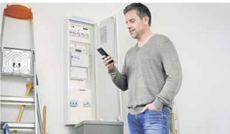
Die Energiewelt von morgen wird dezentraler und digitaler. Mit dem Einsatz intelligenter Stromzähler, den sogenannten Smart Meter, eröffnen sich neue Möglichkeiten der Flexibilisierung.

Ein entscheidender Baustein für die Flexibilisierung des Energiesystems und wichtiges Element für moderne Tarife sind Smart Meter. Die digitalen Zähler messen und übertragen den Stromverbrauch automatisch an den Netzbetreiber und Energieversorger und zeigen in Echtzeit, wie hoch der Strombedarf und -erzeugung gerade sind. Dadurch haben Haushalte ihren Verbrauch besser im Blick und können in Kombination mit passenden Apps Stromfresser künftig leichter identifizieren. Kunden mit Verbräuchen über 6.000 kWh, mit eigener Solaranlage auf dem Dach oder mit steuerbaren Verbrauchseinrichtungen wie Wallboxen, bekommen sukzessive die intelligenten Zähler eingebaut. Das übernimmt in der Regel der örtliche Netzbetreiber.