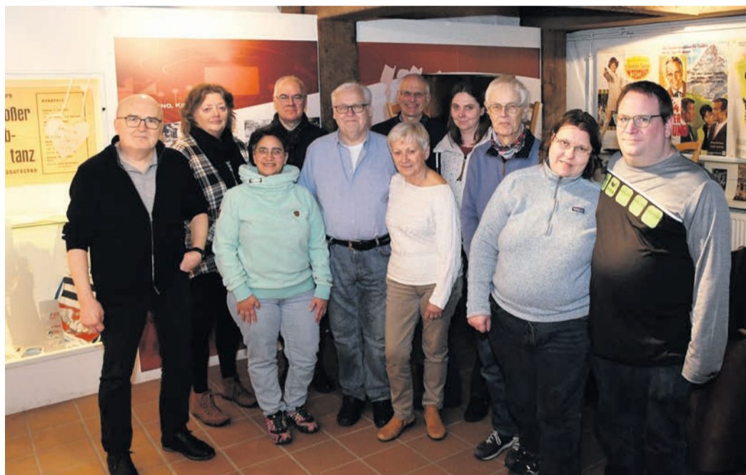
Betten die Verlegung der „Stolpersteine“ in Münster und Altheim am 5. und 6. April mit einem Vortrag und zwei Ausstellungen ein: die AG Stolpersteine, der Heimat- und Geschichtsverein Münster sowie mehrere Künstler (auf dem Foto jeweils einige Vertreter).