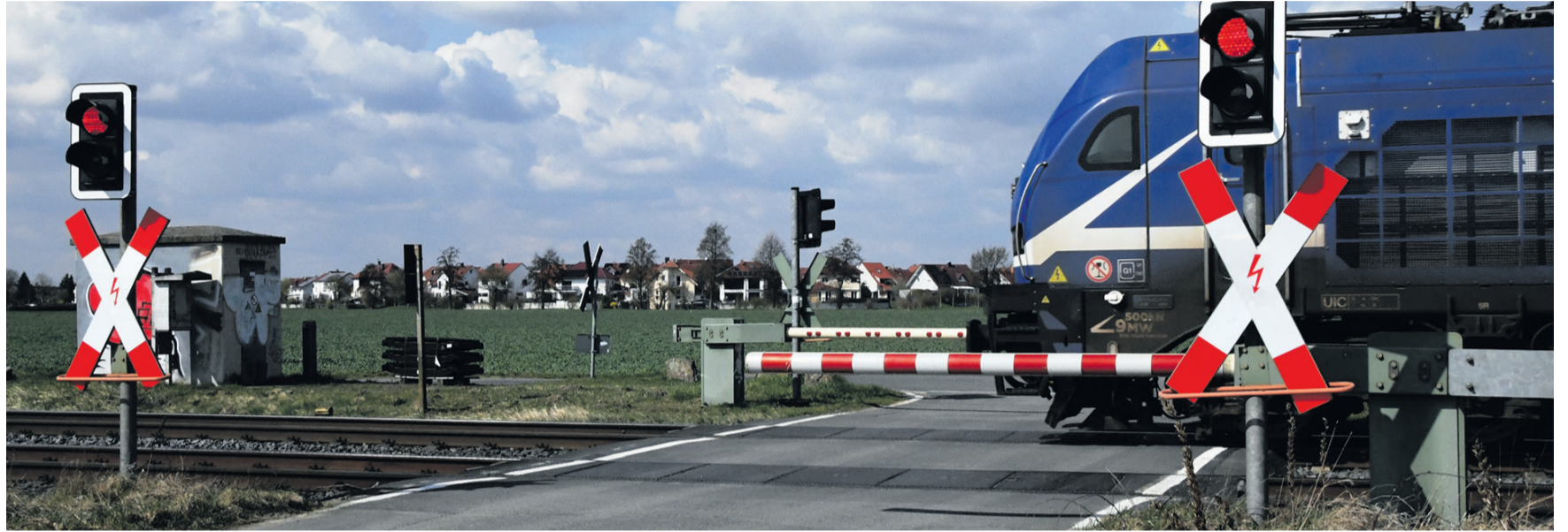
Ein Güterzug passiert von Altheim kommend den Bahnübergang der Anliegern vorbehaltenen Straße „Außerhalb“ zwischen der B26 und Münster. Im Hintergrund ist das „Inselviertel“ zu sehen, unter anderem mit dem Helgolandring. Die Gemeindevertreter haben den Weg für den Bau zweier Lärmschutzwände an der Bahnstrecke Darmstadt-Aschaffenburg freigemacht. Umsetzen will dies die Deutsche Bahn auf einer Länge von einem Kilometer im Jahr 2027.