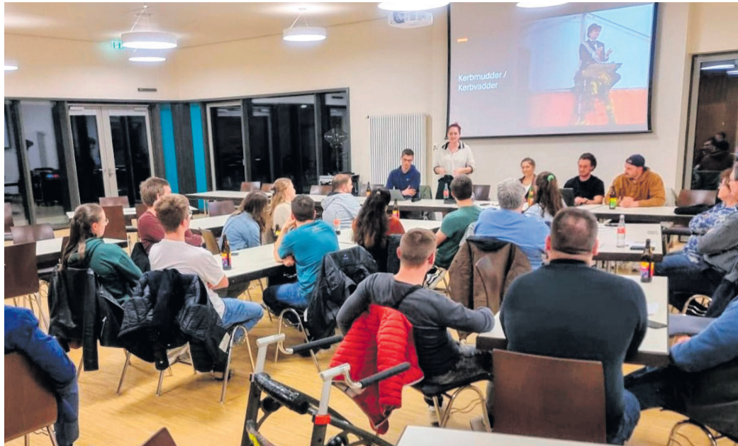
Bei der Jahreshauptversammlung des Kerbverein Eppertshausen wurde ein positives Fazit unter die Feierlichkeiten im letzten Jahr gezogen.

In ihrem Jahresbericht zog sie eine positive Bilanz mit Blick auf die Kerb 2024. Dennoch gebe es eine Reihe von künftigen Herausforderungen. Dazu zählt etwa ein neuer Kerbwagen. Der wurde im letzten Jahr aus Groß-Zimmern geliehen. Zwar erhielt der Verein dankenswerterweise von der Gemeinde Eppertshausen ein Exemplar, allerdings liegt dafür (noch) keine Betriebserlaubnis vor. Derzeit scheint der Aufwand zum Herrichten des