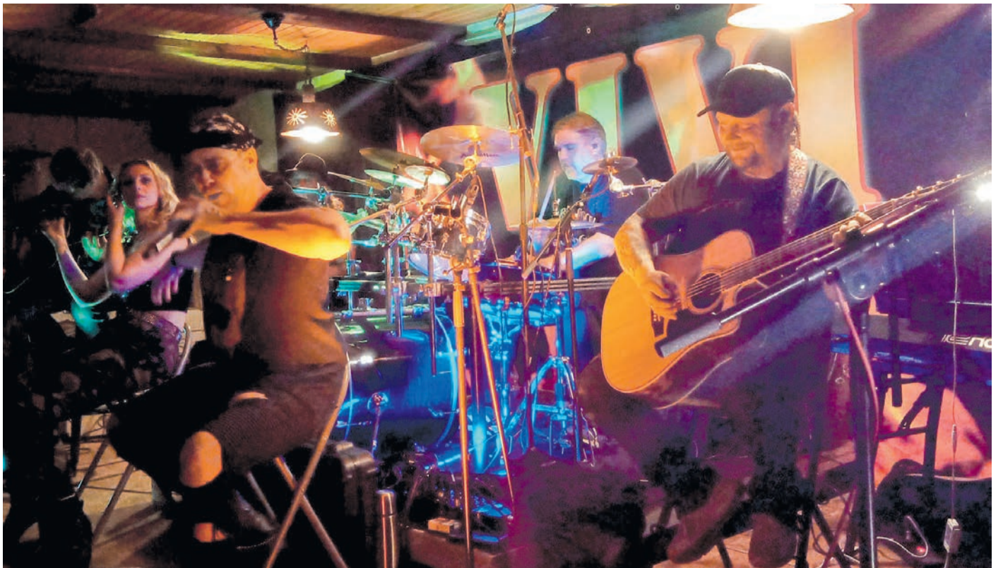
Die Band „VIVI“ feierte im Wanderheim ihre Premiere auf der River Night. Zu den fulminanten Klängen sagte der Vorstand lachend, dass es bei den nächsten Veranstaltungen von „Frisch Auf“ wieder ruhiger wird.

Liebe Leser, die Versorgung des längstlebenden Ehegatten und die Frage der gerechten Behandlung der Kinder ist ein Dauerthema bei uns. Wir freuen uns darauf, Sie auch hier zu beraten. Ein erstes allgemeines Informationsgespräch ist kostenfrei.