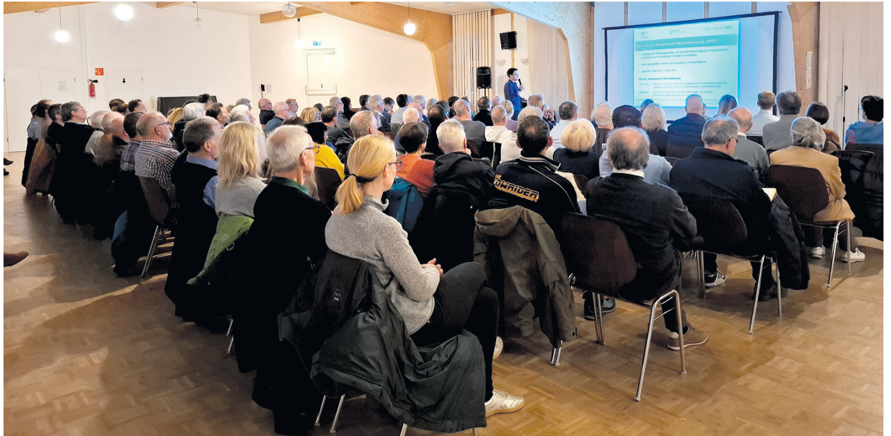
Der sehr gut besuchte Infoabend im Saal für Vereine.

Im Anschluss an die Präsentationen nutzen zahlreiche Bürgerinnen und Bürger die Möglichkeit wertvolle Fragen an das Projektteam zu richten und rege zu diskutieren. So interessierten sich die Anwesenden beispielsweise für die künftige Entwicklung von