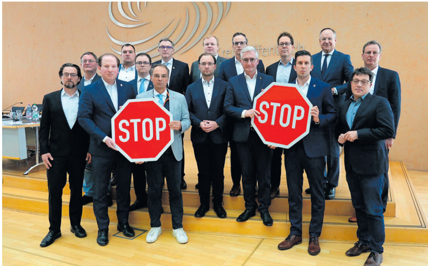
Mit Stop-Schildern zeigen die Bürgermeister der 13 Städte und Gemeinden im Kreis Offenbach gemeinsam mit den drei hauptamtlichen Kreisausschussmitgliedern - Landrat Oliver Quilling (hinten, Zweiter von rechts), Erster Kreisbeigeordneter Carsten Müller (vorne rechts) und Kreisbeigeordneter Alexander Böhn (hinten rechts) -, dass es so nicht weitergeht.

spruchs auf Ganztagsbetreuung für Grundschul Kinder ab 2026 bis zur Klärung der Finanzierung.