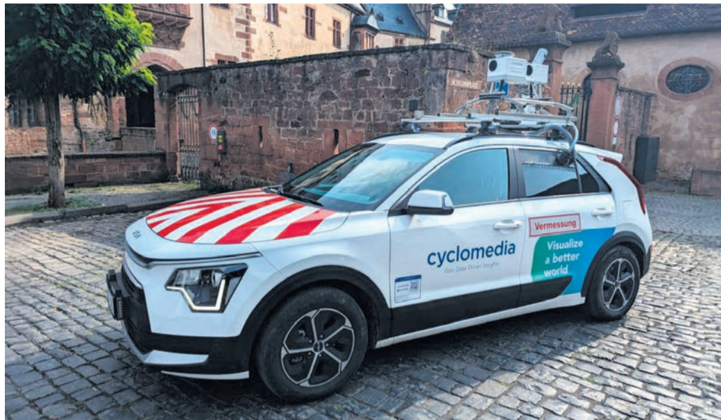
Fahrzeug der Cyclomedia für die 360 Grad Befahrung.

360 Grad Befahrung im Stadtgebiet ab 7. April