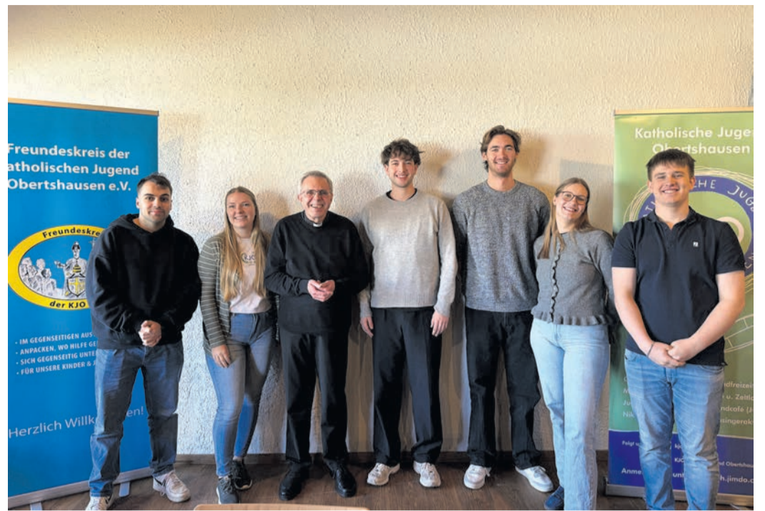
Der neugewählte Vorstand.