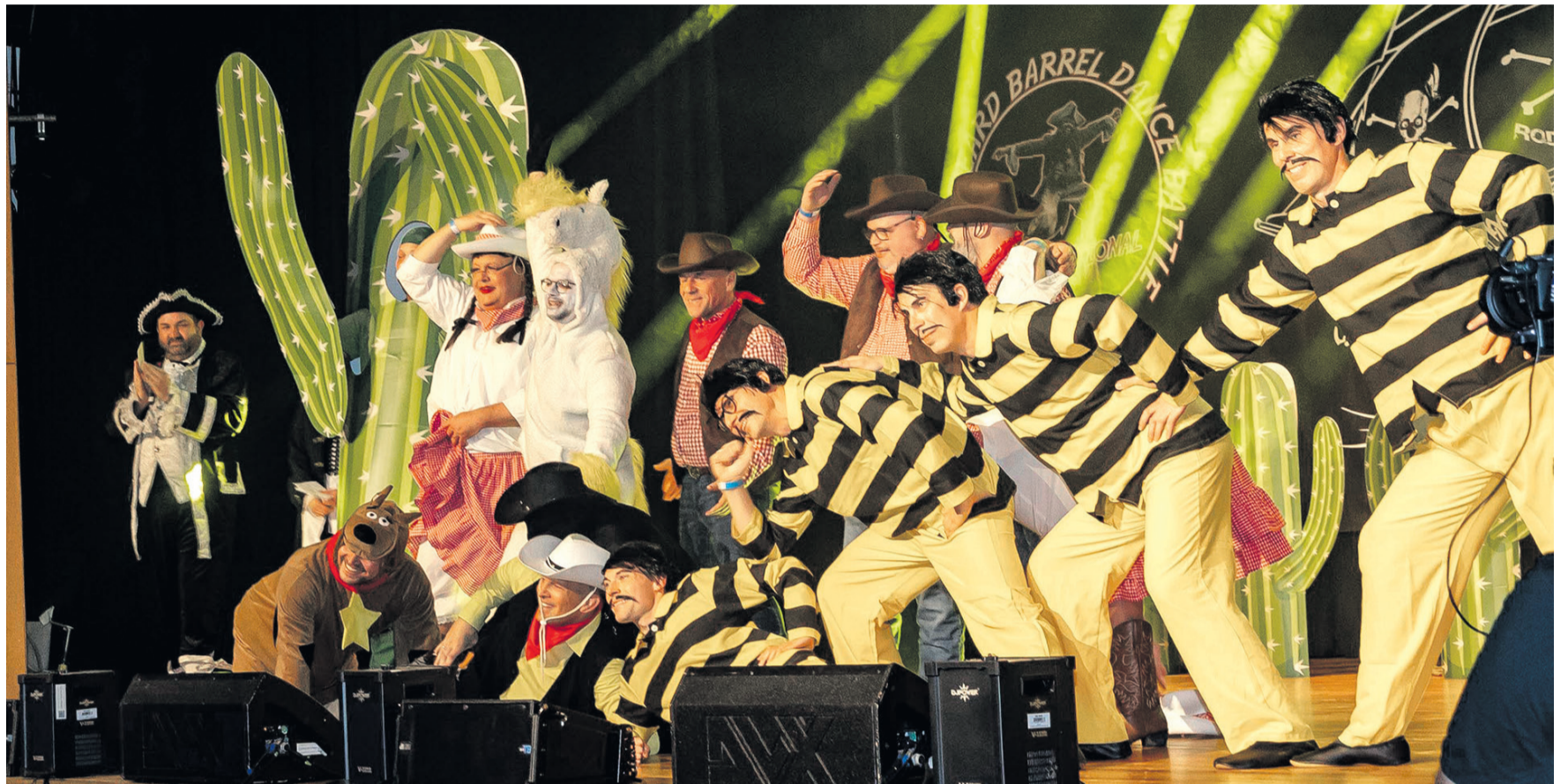
Auftritt der „Rodaupiraten“.