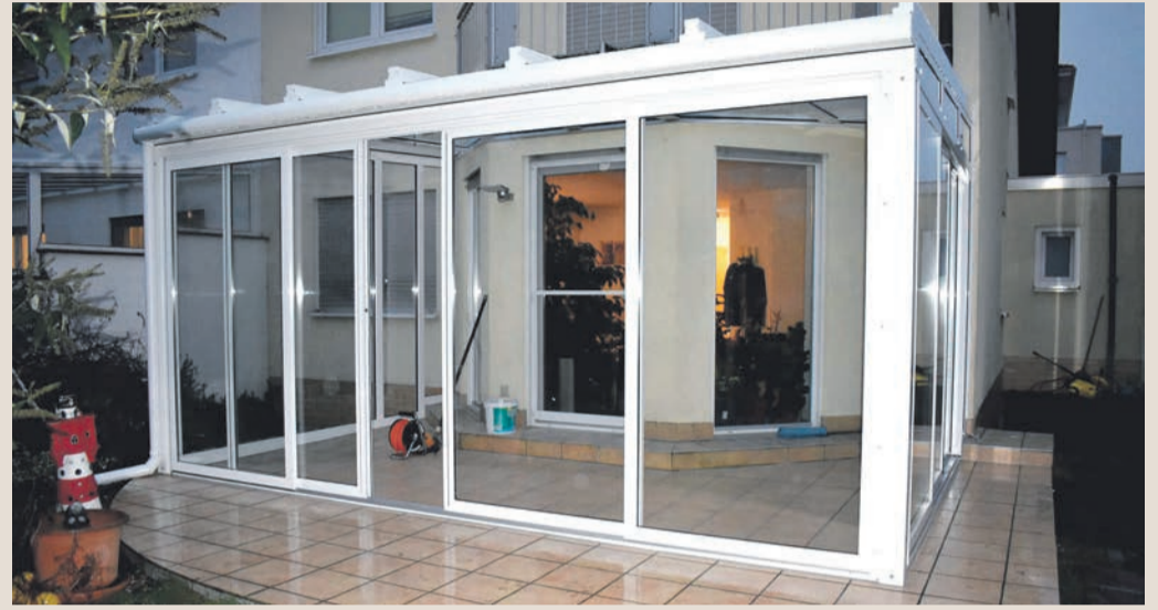
Premium-Terrassenüberdachung mit Qualitäts-Schiebe-Türen.

In den kalten Monaten kann der Sommer-Garten temporär beheizt werden und bietet somit eine ganzjährig angepasste spezifische Nutzung. Weiterhin waren moderne Qualitäts-Kunststoff-