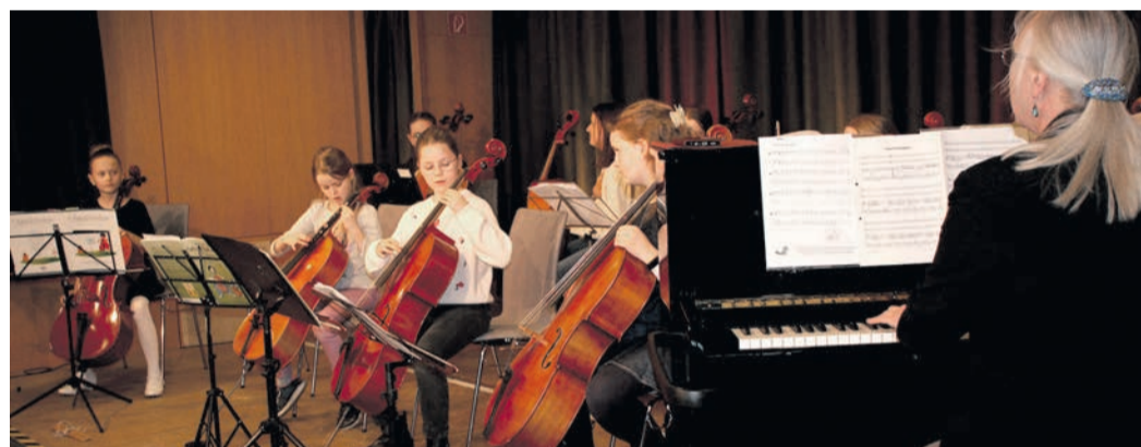
Schülerinnen und Schüler der Musikschule Obertshausen zeigten ihr Können beim Konzert im Kleinkunstsaal.

Obertshausen (NZO) „Schwingende Saiten“ - unter diesem Motto stand das diesjährige Streicherkonzert der städtischen Musikschule Obertshausen, das vor einem sehr interessierten Publikum im Kleinkunstsaal des Bürgerhauses über die Bühne ging.