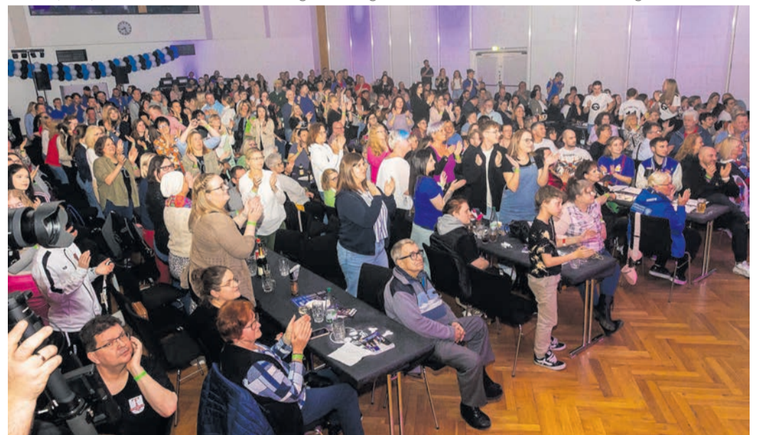
Jede Vorführung der hochmotivierten Gruppen wurde vom Publikum mit viel Applaus belohnt.