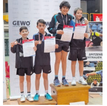
nach fünf spannenden Sätzen.