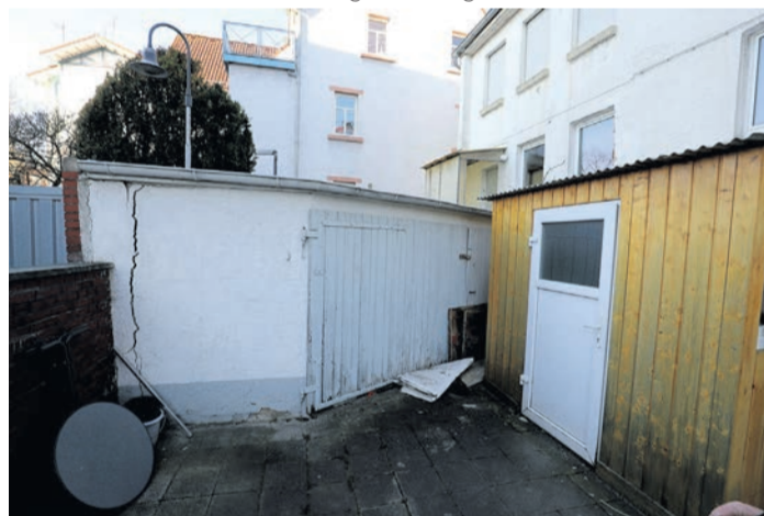
Im Jägerhaus selbst sind die Lagerbedingungen gut. Etwas Sorge bereitet der Stadt die Garage, wo an einigen Kisten Schimmelschäden festgestellt wurden.