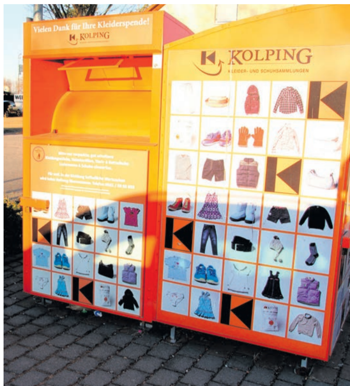
Rund zwei Drittel der Altkleider landen zwischen Flensburg und Garmisch in den Sammelbehältern.

Rödermark (NHR) Die Menschen in Rödermark sollten beim Thema „Altkleider-Verwertung“ auch weiterhin die insgesamt 47 Sammelcontainer im Stadtgebiet nutzen, nach Möglichkeit den Rot-Kreuz-Kleiderladen an der Frankfurter Straße in Ober-Roden noch stärker frequentieren und über ihr eigenes Konsumverhalten nachdenken: Diesen Dreiklang wünschen sich die Wertstoff-Experten der Kommunalen Betriebe (KBR), denn es geht aktuell darum, eine neue EU-Richtlinie, die zu Jahresbeginn in Kraft getreten ist, möglichst pragmatisch und alltagstauglich umzusetzen. Die Vorgabe besagt, dass ausrangierte Kleidungsstücke sowie Bettwäsche und andere Stoffabfälle nicht mehr in der Restmülltonne entsorgt werden dürfen. Die Deutsche Kleiderstiftung empfiehlt jedoch, verschlissene und verdreckte oder gar kontaminierte Alttextilien wie gewohnt mit dem Restabfall abtransportieren zu lassen. „Sauber sammeln“ lautet auch künftig die Maxime. Denn schließlich, und in dieser Betrachtung sind sich die mit der Materie vertrauten Fachleute bundesweit weitgehend einig, verfüge Deutschland im Vergleich mit anderen europäischen Staaten über ein gut aufgebautes Verwertungssystem mit Depotcontainern.