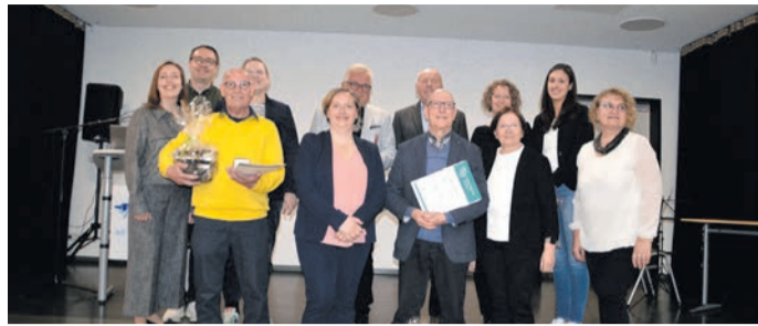
Die geehrten Mitglieder.