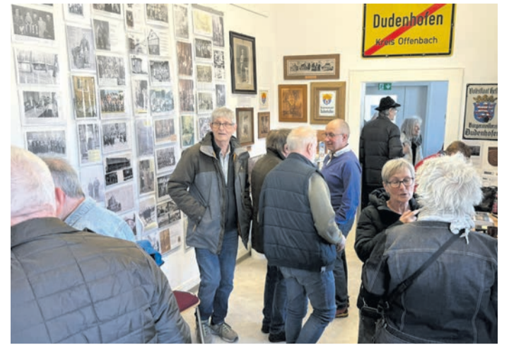
Wiedersehen und Erinnerungen austauschen. Einen kurzweiligen Nachmittag voller Erinnerungen erlebten ehemalige „Jugendhäusler“ beim Tag des offenen Archivs in Dudenhofen.

Teilnehmer ist begrenzt, spätestens zum 7. April anmelden bei Familie Eberhard - d.eberhard@nabu-rodgau.de oder auch unter 0151/67355109. Als Apfelweinprüfer ist jeder eingeladen. Der Anfahrtsweg zur NABU-Hütte in Rodgau-Rollwald unter www.Nabu-Rodgau.de.