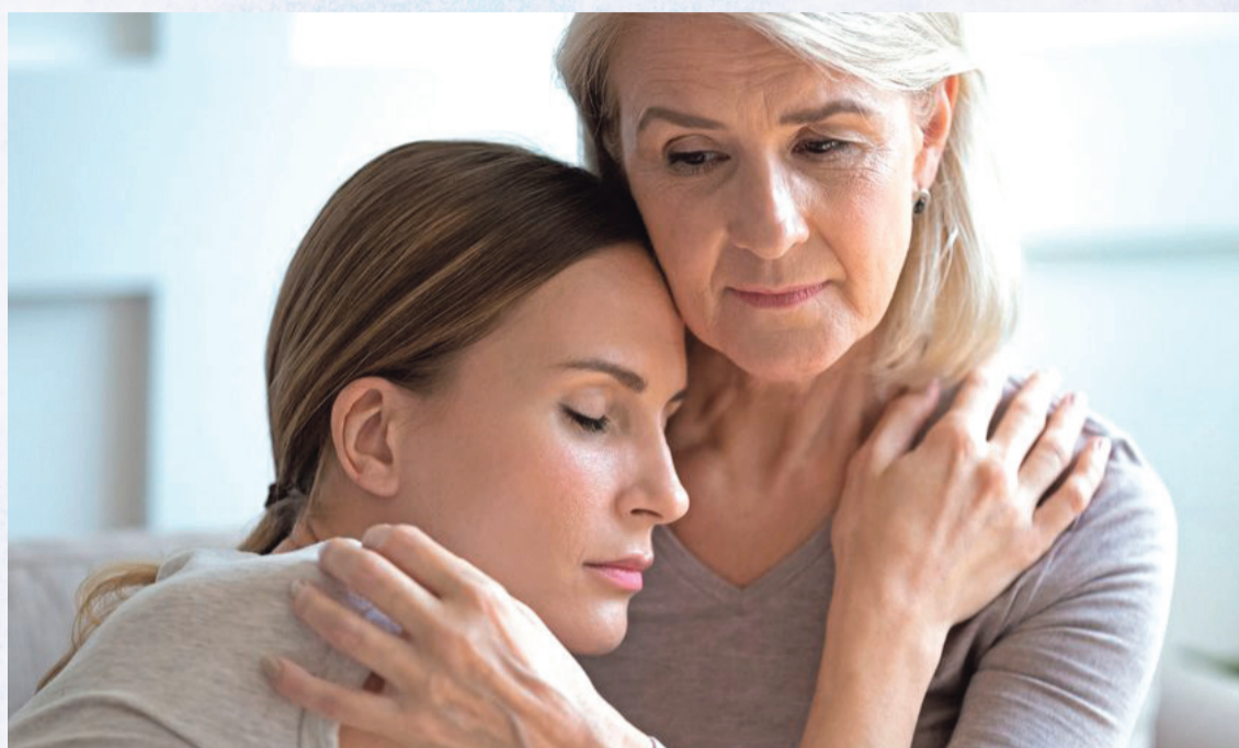
Für die Trauerbewältigung gibt es heute viele alternative Wege - einer davon sind Erinnerungsdiamanten aus Kremationsasche oder aus Haaren.

Wenn man sich für einen Erinnerungsdiamanten aus Haaren entscheidet, kann die gesamte Asche in einer Urne beigesetzt werden. Der Herstellungsprozess