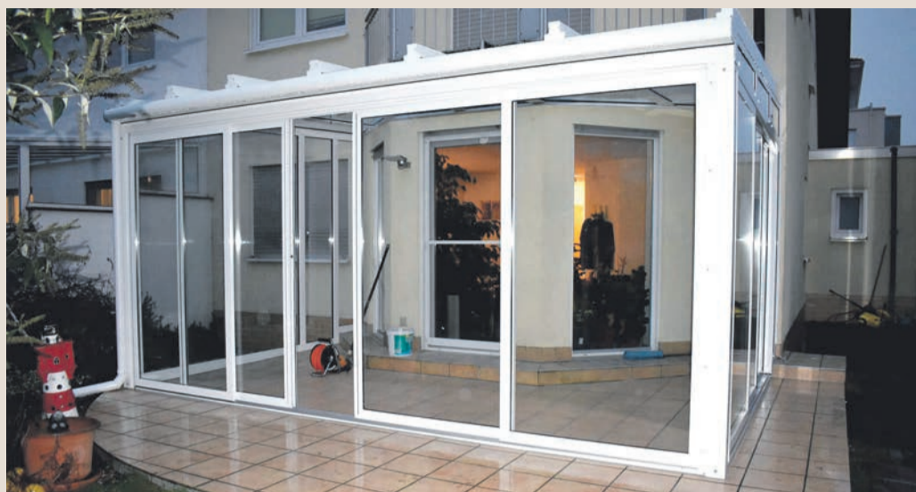
Premium-Terrassenüberdachung mit Qualitäts-Schiebe-Türen.

In den kalten Monaten kann der Sommer-Garten temporär beheizt werden und bietet somit eine ganzjährig angepasste spezifische Nutzung. Weiterhin waren moderne Qualitäts-Kunststoff-