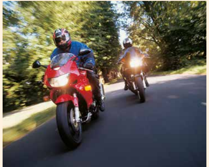
Ein ausreichender Versicherungsschutz sollte unverzichtbarer Begleiter auf jeder Fahrt sein.

Im Gegensatz zur Haftpflicht ist eine ergänzende Fahrerschutzversicherung ein optionaler Baustein. Damit ist auch der Personenschaden des Bikers beim selbst verschuldeten Unfall umfassend geschützt. „Diese Option ist die finanzielle Absicherung für den Biker und seine Familie, falls er bei einem selbst verschuldeten Unfall ernsthaft verletzt wird und zu-