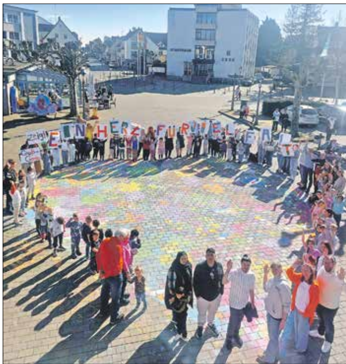
Kreatives Kunstwerk, mit Kreide auf dem Marktplatz gestaltet: Die Aktion „Colour your place“ machte die interkulturelle Vielfalt in der Kreisstadt Groß-Gerau deutlich.

KREISSTADT GROSS-GERAU – An den Rändern des großen bunten Herzens mitten auf dem Marktplatz wurden unter Applaus Schilder mit einzelnen Buchstaben in die Höhe gehalten: „Groß-Gerau zeigt ein Herz für Vielfalt“ stand auf dem daraus geformten Schriftzug zu lesen, während überall Kinder herumwuselten, die Smartphone-Kameras klickten, als die Menschen im Kreis um das Herz herum fröhlich winkten, und man sich rundum gemeinsam über dieses schöne Bild freute.