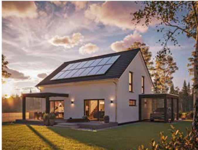
Damit der Traum vom Eigenheim kein Wunschtraum bleibt: Spezielle Hauskonzepte bieten Familien eine erschwingliche und komfortable Lösung für ihr Zuhause.

Beim Bau des Traumhauses sollte nichts überstürzt werden. Zuerst gilt es, ein realistisches Budget festzulegen und daraus das Beste zu machen. So kann ein kleineres Baugrundstück dazu beitragen, mehr finanziellen Spielraum zu schaffen. Zielführend ist auch ein einfaches und kompaktes Bauen ohne Gauben, Erker und Balkone. Im Trend liegen zudem kompaktere Hausentwürfe, ohne dass die Bewohner auf Wohnkomfort verzichten müssten. Eine clevere Vorplanung trägt ebenso zu einem budgetoptimierten Bauen bei: Aufwendige Konstruktionen und Anpassungen lassen sich dadurch