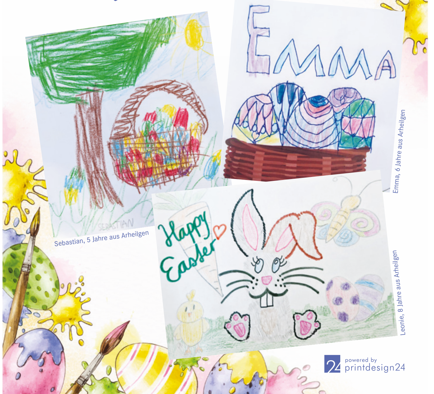
Sebastian, 5 Jahre aus Arheilgen