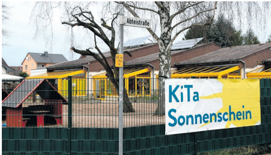
In den Eppertshäuser Kitas bleibt es bei den höheren Verpflegungsentgelten. In der Kita Sonnenschein (Foto) suchten Eltern und die betreibende Kommune nach Einsparpotenzialen, konnten sich letztlich aber nicht zu Budgetkürzungen durchringen. Für viele Familien wird die Betreuung - auch durch die höheren Elternbeiträge - ab diesem Jahr deutlich teurer.

Eppertshausen (jedö) Es war eine umstrittene Entscheidung, die die Eppertshäuser Ortspolitik Ende 2024 traf: Da beschlossen die Gemeindevertreter deutlich höhere Elternbeiträge und Essensentgelte für Familien, die ihre Kinder in den Kitas Sonnenschein und St. Sebastian betreuen lassen. Das ging in manchen Fällen kräftig ins private Haushalts-geld und erntete vor allem mit Blick auf deutlich höhere Kosten fürs Mittagessen Kritik. Daraufhin sondierten in der von der Gemeinde betriebenen Kita Sonnenschein Eltern und Kommune mögliches Einsparpotenzial. Nun ist der Prozess abgeschlossen - mit dem Ergebnis, dass es bei den Steigerungen bleibt.