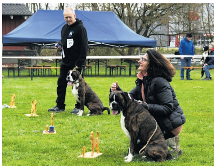
Schlusspose bei der Siegerehrung: Hunde und Halter nach der Wertung vor wenigen Tagen bei der Rassehund-Ausstellung in Eppertshausen.