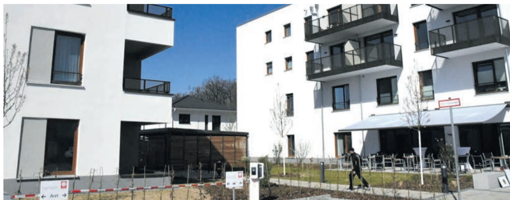
Von den 38 barrierefreien Wohnungen für selbstständige Senioren sind derzeit noch einige frei. Im kleineren Gebäude (l. im Bild) sind ausschließlich zwölf dieser Wohnungen zu finden. Im Hauptgebäude (r.) befinden sich die anderen 26 sowie das Pflegeheim mit 56 Plätzen.

Neben den vier Wohngemeinschaften, in denen sich das 56-köpfige Team um Heim- und Pflegedienstleiterin Sonja Beghith-Kramwinkel vollstationär um jene Menschen kümmert, die intensive Hilfe benötigen, gibt es 38 Wohnungen, die Personen mieten können, die im Alltag keine oder nur punktuelle Unterstützung brauchen. Mit rund 15 Euro Kaltmiete pro Quadratmeter ließen sich die zunächst angestrebten geringeren Mietkosten nicht bis zur Fertigstellung und tatsächlichen Vermietung halten. 26 dieser Wohnungen befinden sich im Gebäude des Senioren-