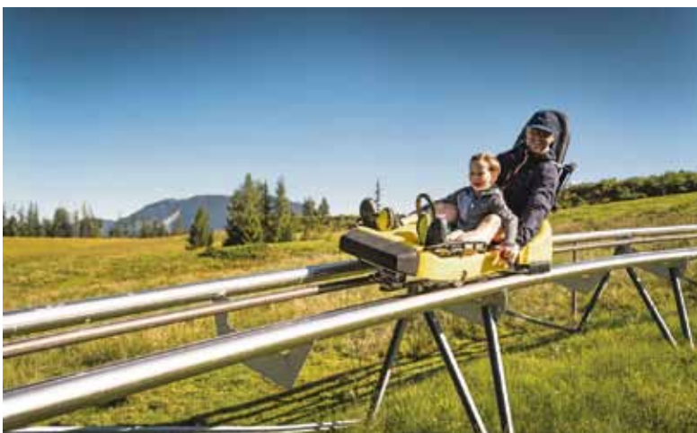
Auch eine Belohnung: Den Berg hinuntersausen im Timoks Alpine Coaster.

gerlebnisswelten zum Forschen und Entdecken ein. In Timoks Wilder Welt gibt es unter anderem einen Klettergarten und Alpine-Coaster, im Triassic Park in Waidring dreht sich alles um die Urzeit und im Erlebnispark Familienland lockt die größte Familienachterbahn Österreichs. Besonders praktisch: Der Eintritt zu den Hauptattraktionen, Badeseen und anderen Programmen ist in der Pillerseetal Card inkludiert.