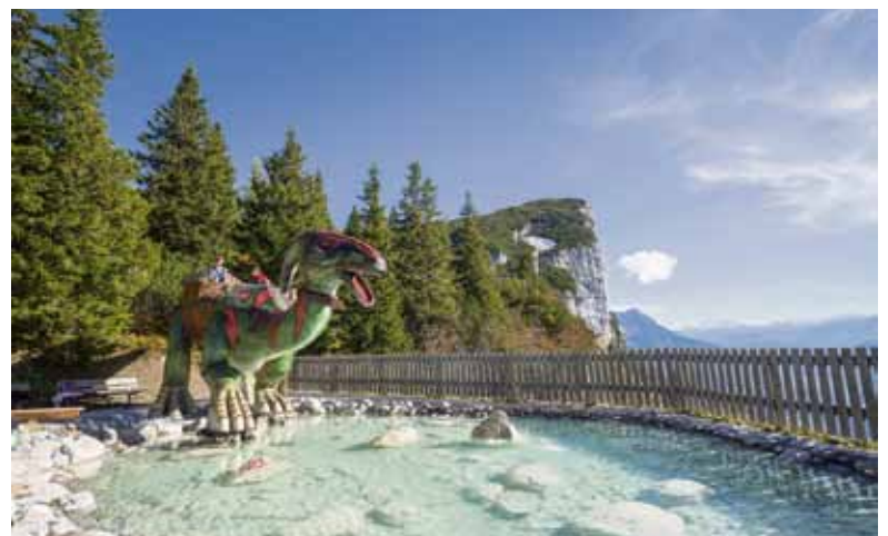
Im Triassic Park auf der Steinplatte freuen sich Urzeit-Bewohner auf einen Besuch.