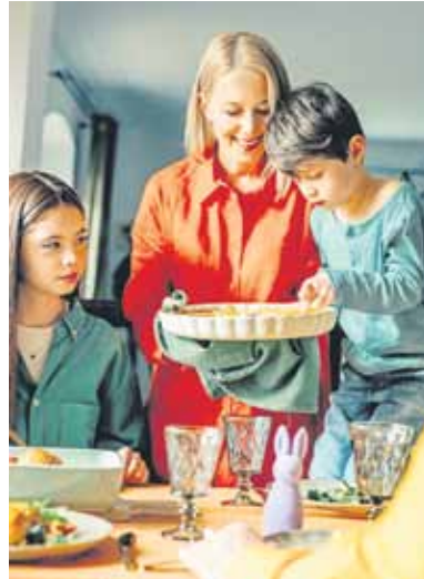
Das perfekte Backergebnis verlangt nicht nur gute Rezepte, sondern auch das richtige Wissen über Zutaten und Techniken. Backpulver etwa sorgt dafür, dass der Teig locker und luftig wird.

Ein unverzichtbares Triebmittel in vielen Osterrezepten ist Backpulver. Es sorgt dafür, dass der Teig locker und luftig wird. Doch wie funktioniert es eigentlich? Backpulver besteht aus Natron (Natriumbicarbonat), einem Säuerungsmittel und Stärke, die als Trennmittel dient. Letzteres verhindert, dass die Reaktion des Backpulvers bereits in der Packung einsetzt. Das Natriumbicarbonat basiert auf Soda, das im sogenannten Solvay-Verfahren aus