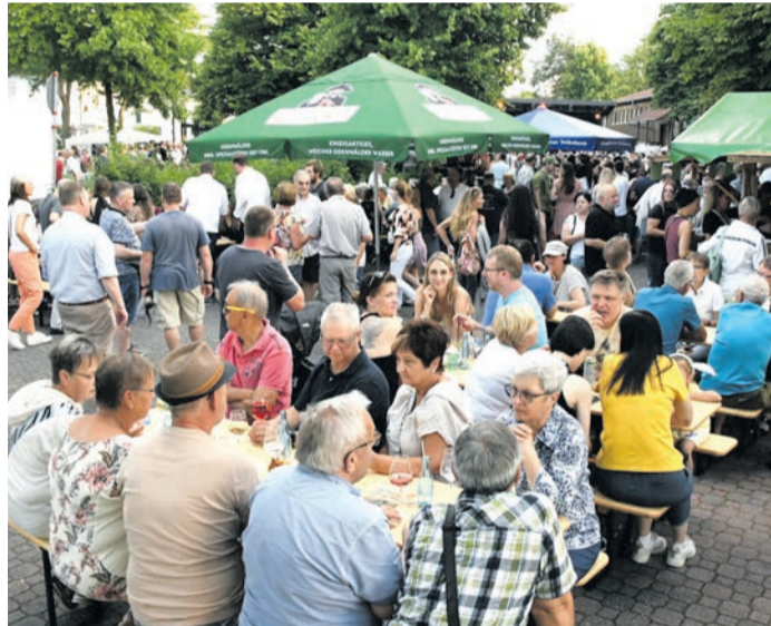
Der Münsterer Bahnhofplatz beim „River Night Summer Special“ 2022. Sein Potenzial als Veranstaltungsort hat der Platz in jüngerer Vergangenheit schon angedeutet.

ein Münsterer Eigenanteil an der Finanzierung in Höhe von 160.000 bis 180.000 Euro bleibe. Dies wäre auch der Eigenanteil bei der von den drei anderen Fraktionen favorisierten und mit kleineren Anpassungen beschlossenen Variante. Sie wird mit Gesamtkosten in Höhe von 529.100 Euro veranschlagt und sieht im Kern eine verkehrsfreie Platzmitte, zusätzliche Pflanzbeete, den Erhalt des derzeitigen Fahrradunterstands, den Erhalt des bestehenden Wartehäuschens (aber mit Erneuerung der Verglasung), ein Leitsystem für Blinde sowie die Ertüchtigung der Grünflächen und des Mobiliars vor. Der Änderungsantrag der FDP, dem auch SPD und ALMA-Die Grünen folgten, integrierte zudem ein Wasserspiel mit drei Düsen, womöglich beleuchtet durch LEDs. Dies könnte - ebenfalls zu zwei Dritteln geförderte - Zusatzkosten von