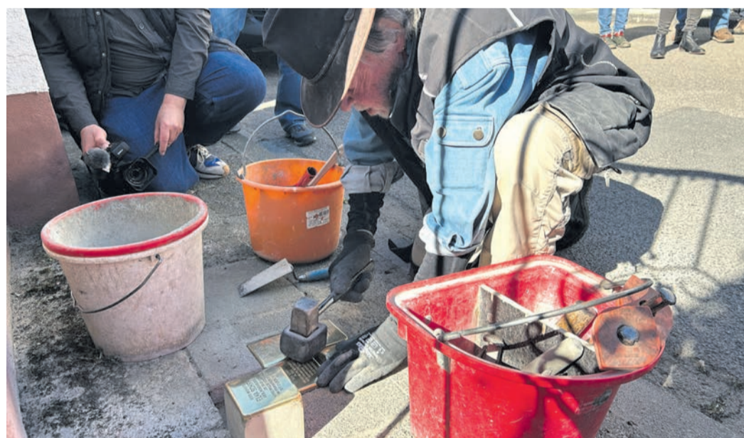
Gunter Demnig bei der Arbeit in Münster und Altheim.