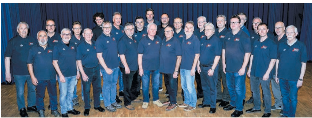
Der MGV-Männerchor. Zu erleben und zu hören selbstverständlich bei der Jubiläumsshow anlässlich des 180. Geburtstags des Vereins am 24. Mai in der Kulturhalle Münster.

Der Männerchor – die Seele des MGV 1845 Münster