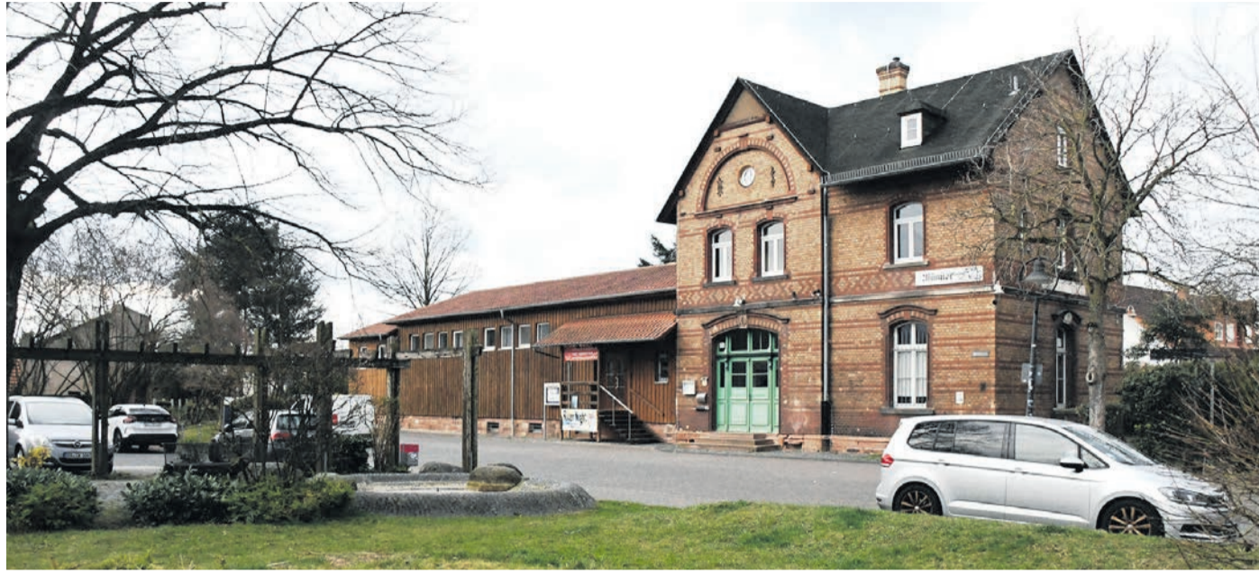
Umgestaltet werden soll der Münsterer Bahnhofplatz (hinten das alte, vom Verein Radsport genutzte Bahnhofsgebäude). Unter anderem soll er autofrei werden. Die Kosten belaufen sich auf mehr als eine halbe Million Euro, von denen die Gemeinde allerdings nur rund 180.000 Euro selbst tragen muss.

Münster (jedö) Ob der Vorplatz des Münsterer Bahnhofs eine Örtlichkeit ist, die unbedingt ein neues Antlitz braucht, darüber darf man gerade in Zeiten knapper Haushaltsmittel streiten. Die Gemeindevertreter jedenfalls waren in ihrer jüngsten Sitzung überwiegend der Meinung, bei gleichzeitiger üppiger Landesförderung auch kommunales Geld in jenen Flecken zu investieren, der in jüngerer Vergangenheit beim „River Night Summer Special“ und beim Weihnachtsmarkt sein Potenzial auch für Veranstaltungen angedeutet hat. Mit den Stimmen von SPD, FDP und ALMA-Die Grünen beschloss das Parlament gegen das Votum der CDU-Vertreter eine von mehreren Umbauvarianten, in die auf den letzten Drücker unter anderem noch ein Wasserspiel aufgenommen wurde.