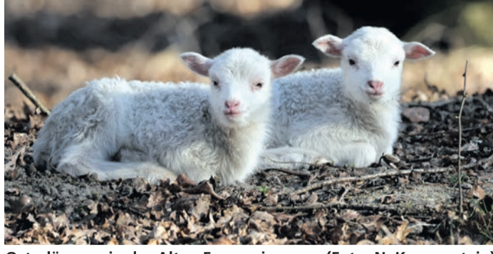
Osterlämmer in der Alten Fasanerie.

Pünktlich zum Fest sind bei den Moorschnucken die ersten Lämmchen angekommen. Anfang Februar sind die ersten 4 Moorschnucken zu uns in den Park gezogen. Moorle, Schnucki, Wölkchen und Flöckchen haben sich gut eingelebt im ehemaligen Wildschweingatter. Vor zwei Tagen hat Moorle Zwillinge zur Welt