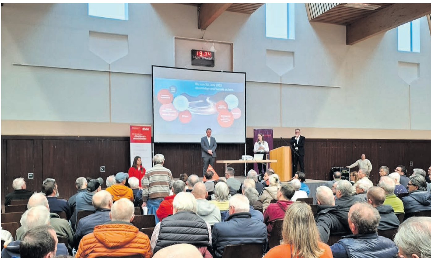
Zahlreiche Bürgerinnen und Bürger nutzten die Möglichkeit Fragen an die Vortragenden zu richten.