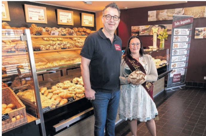
sie die leckeren Produkte und schwärmte von dem echten Handwerksbäcker. „Brot ist etwas Besonderes und das kann man hier mit allen Sinnen genießen.“

In der Rodgauer Traditionsbäckerei Schäfer, die Filialen auch in Heusenstamm, Obertshausen und Rödermark erfolgreich betreibt, verkostete